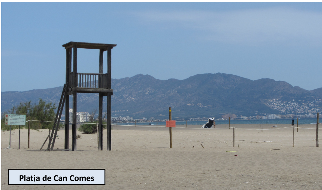
Platja de Can Comes