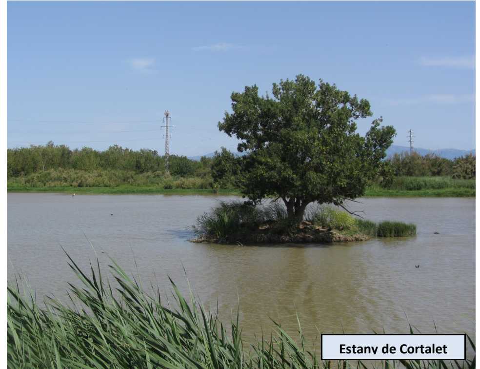
Estany de Cortalet

Vista panorámica del Parque y de casi toda la comarca. En los escalones podemos ver pintadas las huellas de diversas de las especies animales que se hallan por los alrededores. Retornamos al camino principal y proseguimos hacia la playa. Llegando a la Bassa del Matar, encontramos otro desvío, de apenas una cincuentena de metros a la izquierda, al Aguait del Bruel.