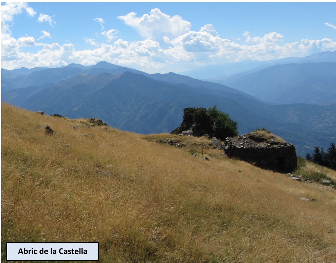
Abric de la Castella