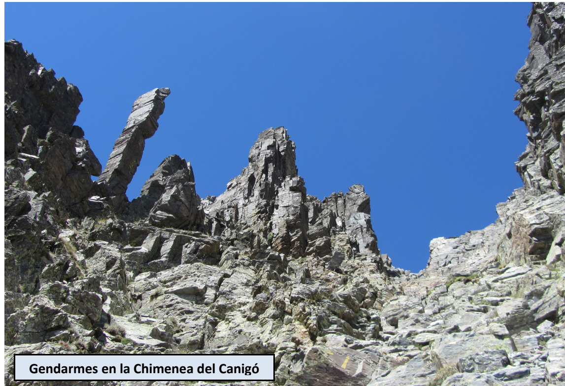
Gendarmes en la Chimenea del Canigó