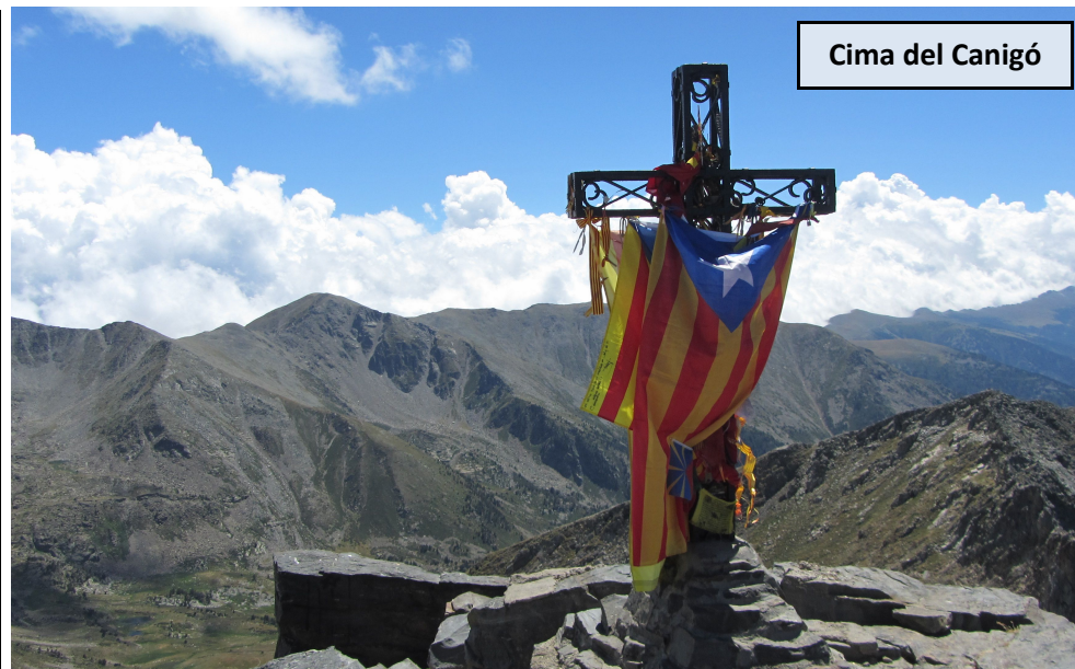
Cima del Canigó

Discreta cima, que pasa desapercibida por estar en medio de la loma. Al poco de pasarla comenzamos a girar a la derecha, ligeramente al E-NE, como si fuéramos a Cortalets. Pasada la Font de la Perdiu, a unos 2.260 metros de altura, saldremos a la intersección con el GR 10. Lo seguimos a la izquierda (NO) en dirección opuesta a Cortalets para retornar hacia Marialles. En 15-20 minutos tras tomar el GR 10 estaremos ante el Roc de les Hores (2.065 m), una pequeña punta con rocas que parecen amontonadas unas sobre otras. Aquí el GR gira hacia el SO y baja con más fuerza, para alcanzar rápidamente un llano casi desforestado donde se emplaza el Abric de la Castella, una barraca circular de piedra seca. Pasada ésta, nos internamos en terreno boscoso y fuerte descenso hasta desembocar a una amplia pista de tierra, donde un cartel nos indica que estamos a 4 horas del Refugio de Marialles. Unos 100 metros más adelante tenemos el Refugio libre de Bonaigua.