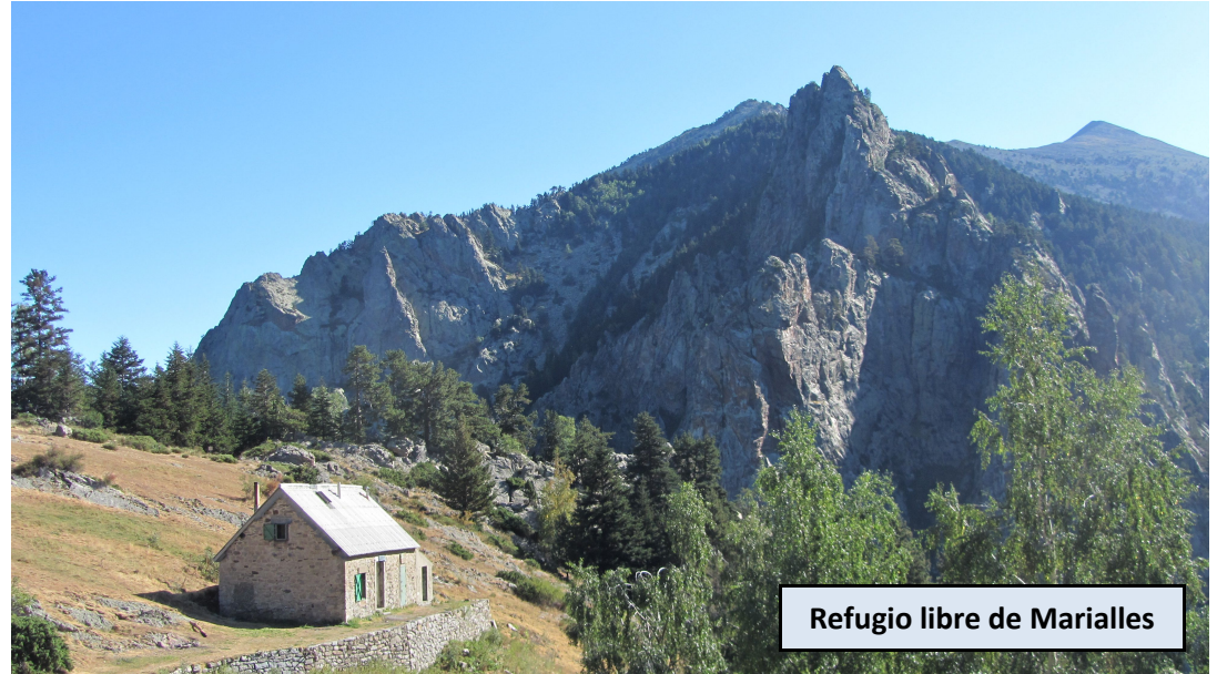
Refugio libre de Marialles

Refugio guardado de 53 plazas, con todos los servicios. Seguimos el GR 10 hasta una impresionante explanada, con espectaculares vistas al macizo del Canigó, donde tenemos a tiro de piedra el refugio libre de Marialles. Seguimos el GR en dirección al Pic del Canigó y al Refugio Aragón, obviando el desvío al Pla Guillem. En pocos minutos pasamos junto a una cabaña de pastores y un merendero con fuente. La senda prosigue en dirección al Riu de la Llipodera y lo cruza por un puente. A partir de este punto empezamos a ganar altura suavemente, sin dejar el indicadísimo GR. Desde el Coll Verd (1.860 m de altura) el camino hace un suave y prolongado flanqueo, ofreciendo hermosas vistas sobre el valle a nuestros pies. Dejamos atrás la Font d'en Martí y finalmente llegamos al Riu de Cadí, que debemos cruzar. Ahora el GR cambia la dirección y en 10-15 minutos llegamos a un marcado cruce.