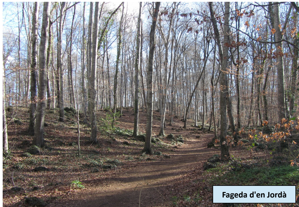
Fageda d'en Jordà