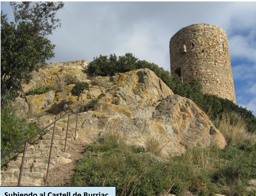
Subiendo al Castell de Burriac