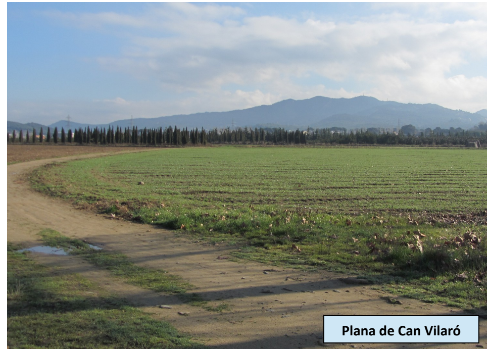
Plana de Can Vilaró

Desde esta pequeña cima podemos disfrutar de buenas vistas a Vilanova del Vallès, al Castell de Sant Miquel y a la Serralada de Marina. Retornamos por la pista a las calles y al último cruce que hemos pasado, donde ascenderemos a una calle señalizada como calle sin salida. En medio de ella sale un camino que pasa a la derecha de las casas que hay al límite de la urbanización, desde donde se nos hace visible la Serra de Céllecs. Llegados frente al camino que va a Cal Gavatx, que es propiedad particular y donde hallaremos una puerta y un muro de ladrillos, deberemos tomar un sendero que sale a la derecha de esta puerta bordeando el Turó de Can Nadal por el Sur hasta salir a una pista que nos lleva a la Plaça de Can Pei. Por la misma pista, seguiremos en dirección Este en ligera subida hasta llegar a Can Jep de la Mel, donde abandonamos la Ruta de Céllecs y seguimos por el camino que conecta con el GR 92. 1kilómetro más adelante llegamos a un llano, la Plana del Fum, y donde enlazamos con el GR 92.