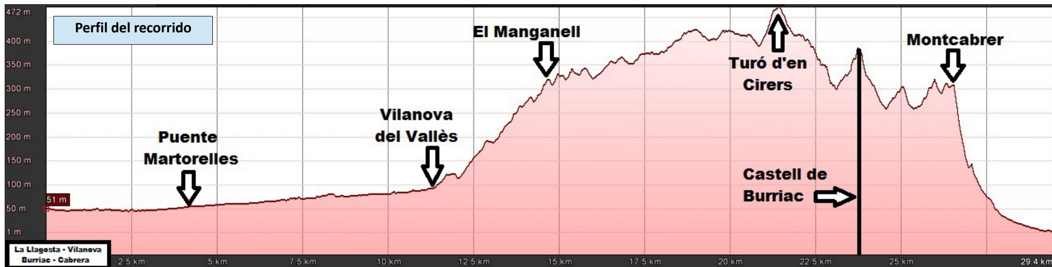
Perfil del recorrido