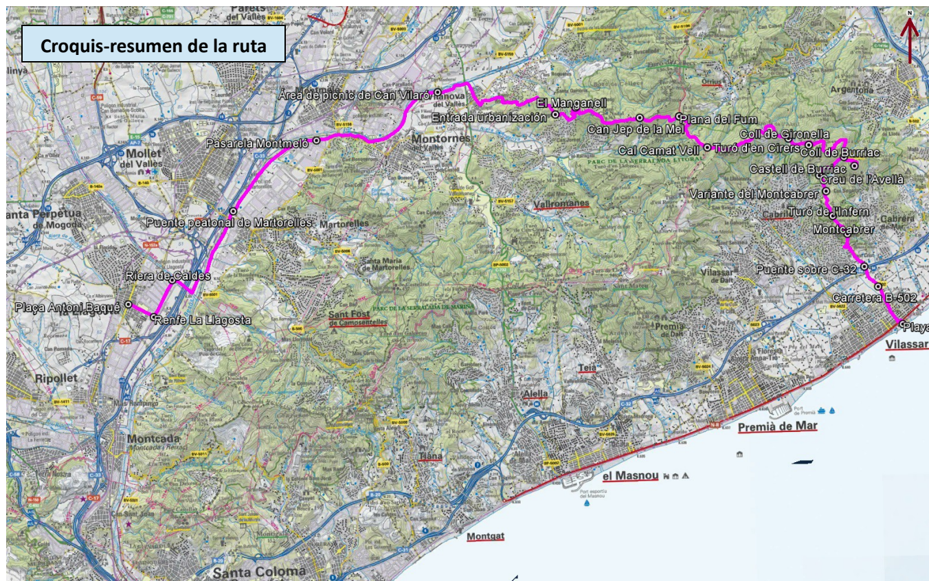
Croquis-resumen de la ruta

Larga travesía que parte de La Llagosta y remonta el curso del Río Besòs y posteriormente del Mogent, pasando por Mollet del Vallès, Montmeló, Montornès del Vallès y finalmente Vilanova del Vallès. En esta última población comenzamos a ascender por la urbanización de Can Bosc hacia la Serra de Céllecs, desde donde encaramos el camino al Castell de Burriac, estética edificación del siglo XI restaurada el 1994, muy conocida en la zona. Las vistas a la costa son magníficas. Descenderemos ahora por el Montcabrer, otra cima cercana con grandes vistas y desde allí iniciaremos el descenso final a la playa.