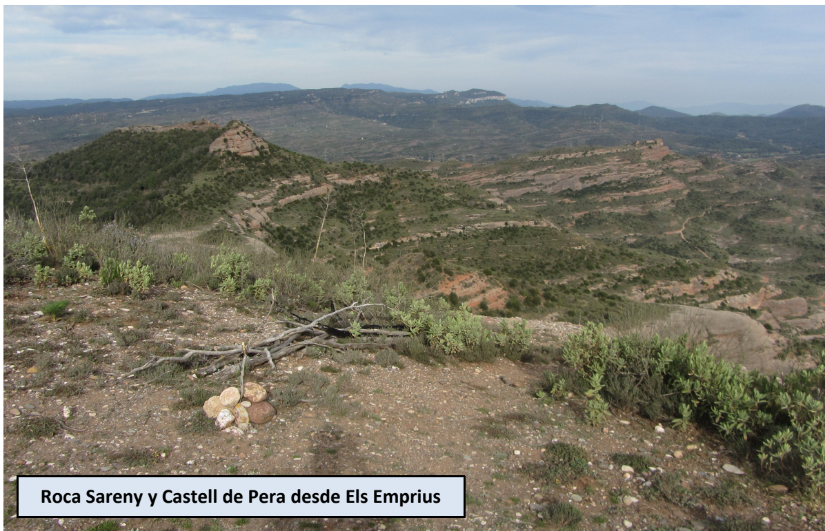
Roca Sareny y Castell de Pera desde Els Emprius