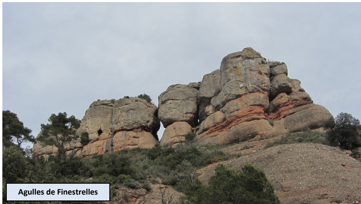
Agulles de Finestrelles