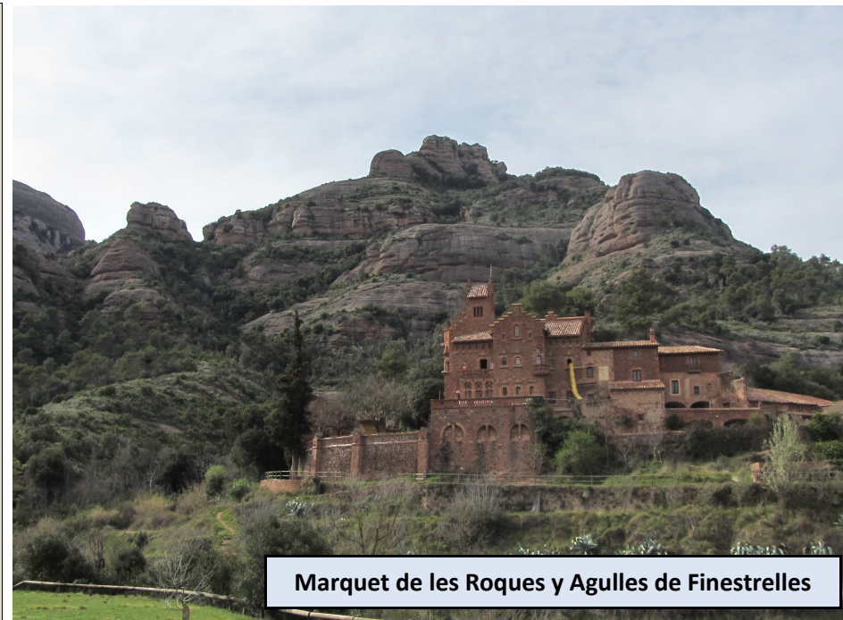
Marquet de les Roques y Agulles de Finestrelles

Volvemos a la pista y 400 metros después, aguas arriba, alcanzamos el Pont de la Font del Llor (560 m). Dejamos en este punto la pista, tomando la senda indicada a mano izquierda que gana altura junto al Torrent de la Font del Llor. En 10-15 minutos más habremos llegado a la Font del Llor, a la que accedemos por unas escaleras.