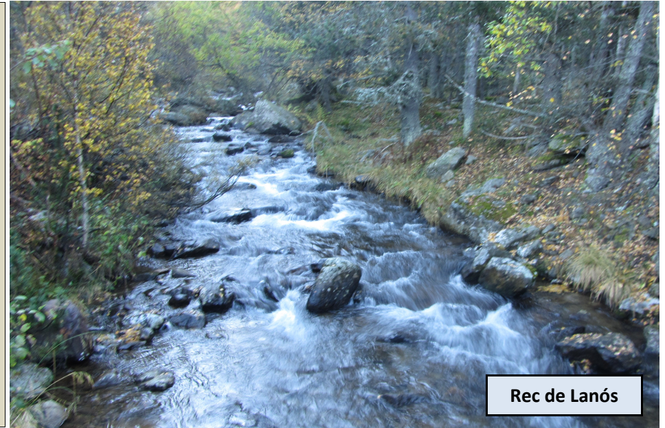
Rec de Lanós

Refugio libre y muy bien cuidado, con fuente junto a él. El sendero se torna más suave ahora y se encamina al desagüe del lago, donde encontramos marcas de GR y nos dirigimos directo al embalse, ahora por pista. Cuando estamos en la parte inferior de las paredes del embalse, tomamos una senda en dirección NE, a la derecha del lago y que nos conducirá hasta la cabecera del mismo.