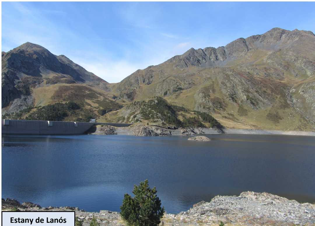
Estany de Lanós