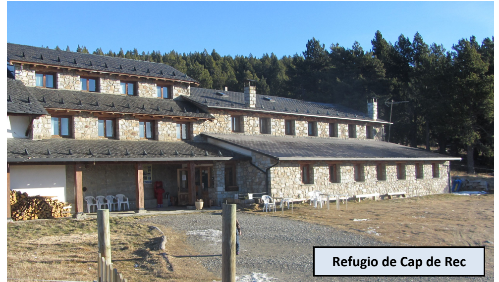
Refugio de Cap de Rec

Refugio de propiedad privada de gran capacidad, junto a las pistas de esquí de fondo y de raquetas de nieve de Lles de Cerdanya. Desde aquí podemos disfrutar ya preciosas vistas a la Tossa Plana de Lles y a la cara Norte del Cadí. Nos dirigimos a los itinerarios balizados para raquetas de nieve, que empiezan junto al restaurante. Encontraremos numerosas marcas por una bonita senda que se interna entre pinos y abetos, en moderado ascenso al N. Hallaremos en sucesivos cruces indicaciones al Estany de l'Orri, que nos guiarán siempre por el ramal de la derecha. Pasada la cota de 2.050 metros llegamos a una pista de tierra, que nos llevaría a Les Pollineres y al refugio de los Lagos de la Pera. Cruzamos la pista y continuamos hacia el Norte en fuerte ascenso. La pendiente se va suavizando hasta que llegamos al Estany de l'Orri.