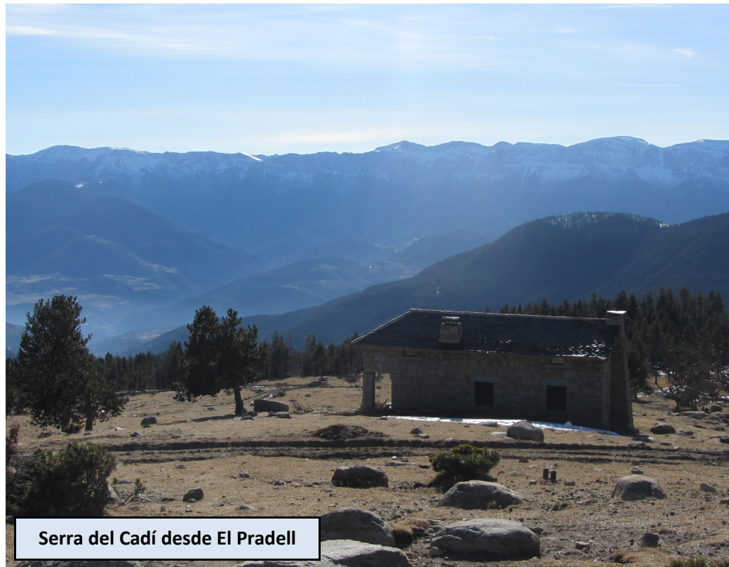
Serra del Cadí desde El Pradell