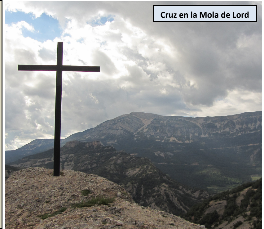
Cruz en la Mola de Lord

Descendemos unos metros hasta el Santuari de Lord, que tiene en su interior a la Mare de Déu de Lord, una imagen del siglo XVI. En la explanada que hay a la entrada del santuario hallamos indicaciones al Grau de Sallord, hacia donde nos dirigimos para completar la ruta circular. Iniciaremos el camino descendiendo por medio de llanos hacia el Sur, hasta llegar a un poste indicador. Aquí giraremos a la izquierda para dejar las explanadas y descender, de manera sencilla, por un camino que traza lazadas y pierde altura. En unos 10 minutos llegaremos a una curva, con una plaquita metálica en el suelo, que nos indica el desvío al mirador, al que nos dirigimos.