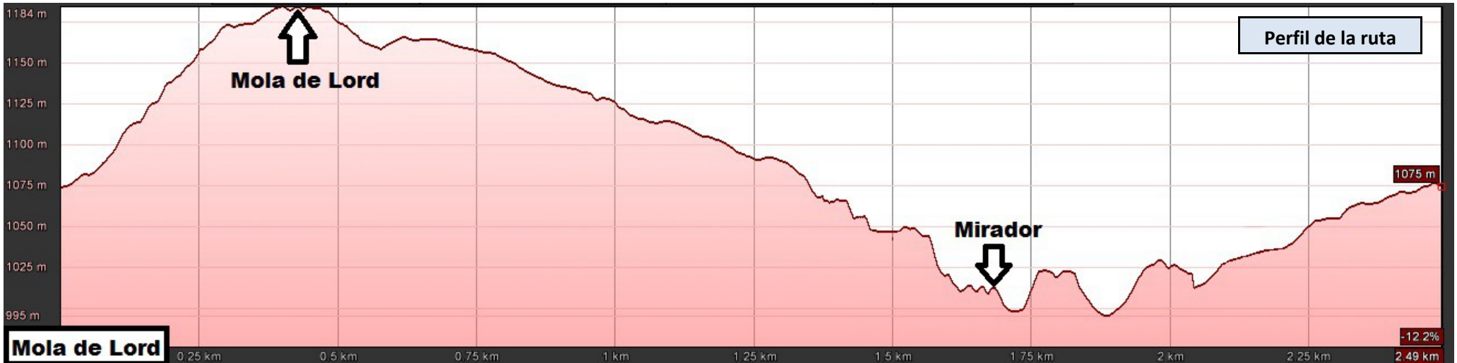
Perfil de la ruta