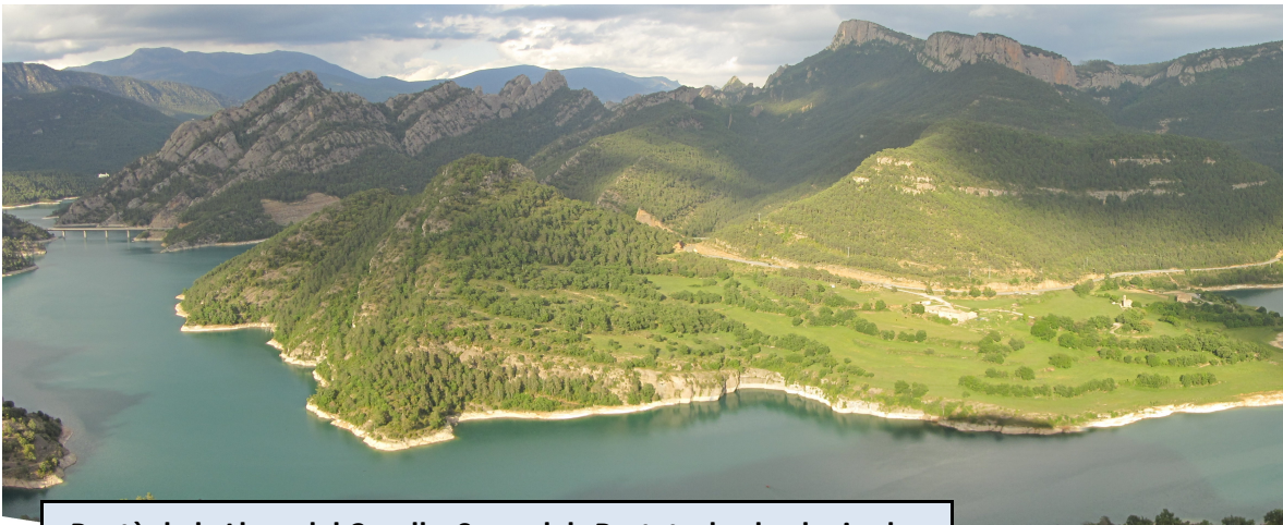
Pantà de la Llosa del Cavall y Serra dels Bastets desde el mirador