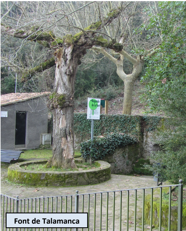
Font de Talamanca