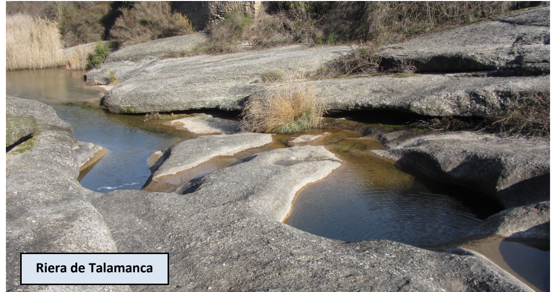
Riera de Talamanca

Al final de la calle del castillo hallamos las marcas del camino que desciende hacia el Molí del Menut. Podemos desviarnos unos metros para ir a ver la Bassa del Cardona. Descendemos por pista poco más de un centenar de metros hasta encontrar un desvío indicado a la derecha. Seguimos perdiendo altura, siempre por pista, con indicaciones de la dirección al Molí del Menut en cada cruce.