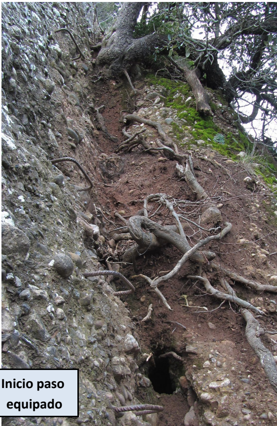
Inicio paso equipado