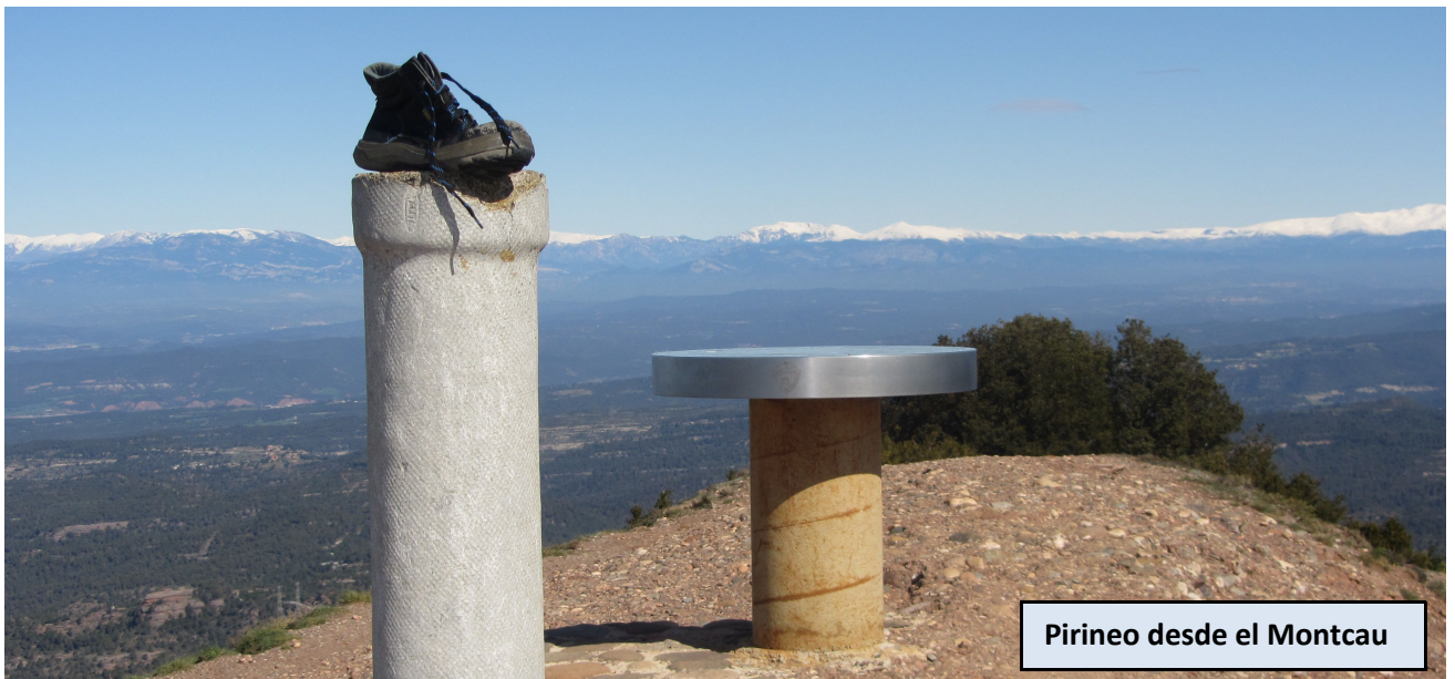
Pirineo desde el Montcau