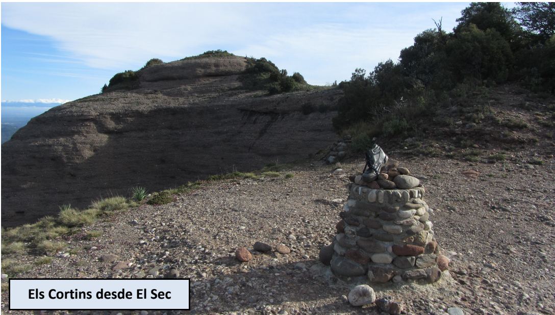
Els Cortins desde El Sec