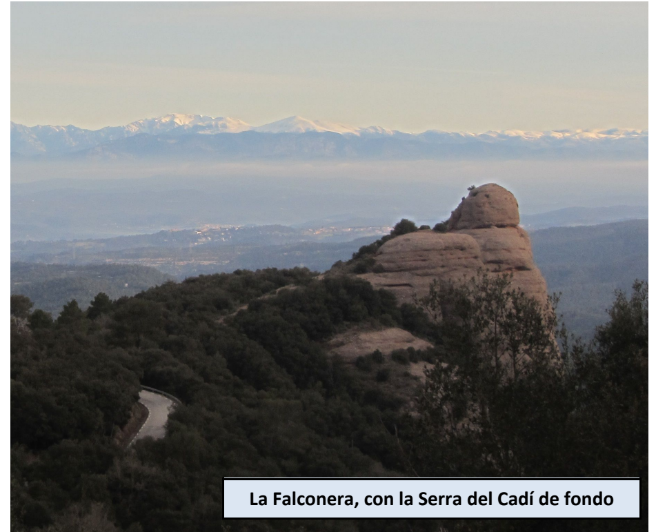
La Falconera, con la Serra del Cadí de fondo

Hallamos aquí el giro a mano derecha, dejando el camino que nos llevaría a la Font del Forat. Subimos decididamente hacia la base de Els Cortins, pasando por una zona entre árboles. Cuando volvemos a ver conglomerado, giramos a la derecha y dejamos el camino por un lomo de un par de metros de dicho material, en este caso de color marronoso. Unos hitos nos confirman el desvío. Descendemos mínimamente y enseguida encontramos la espectacular entrada al vertical paso equipado.