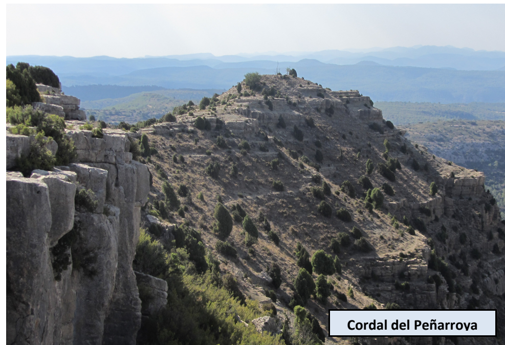
Cordal del Peñarroya

Collado que se halla encima de la ermita de la Magdalena, que vemos unos 80 metros por debajo nuestro. Buenas vistas a Fuentes de Rubielos y al cordal del Peñarroya. Encontramos en él un peirón en homenaje a un vecino fallecido del pueblo. Seguimos por el camino que sigue al Peñarroya, en leve ascenso y sin dejar el cordal ni las indicaciones del PR. Pasaremos por delante de un navajo (charco de aguas pluviales) y de otro corral. No tardaremos en alcanzar la amplia cima del Peñarroya.