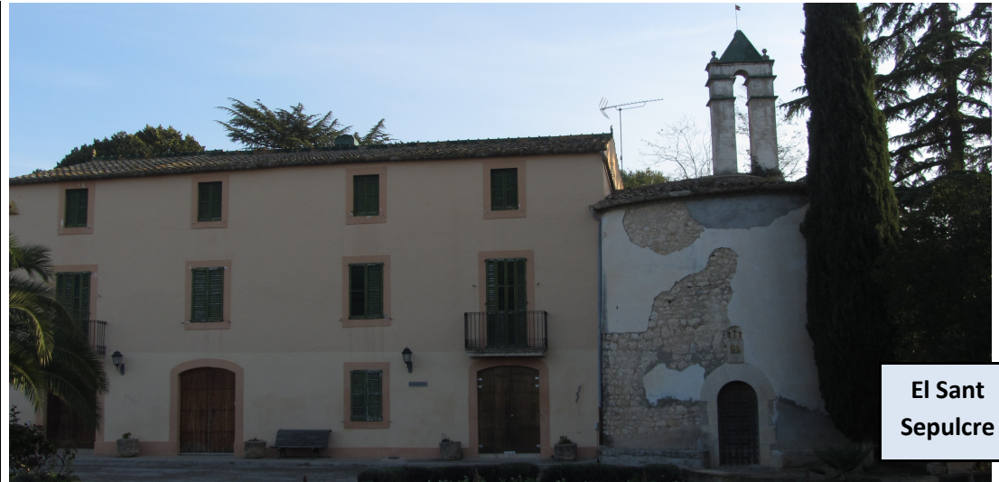
El Sant Sepulcre

Ermita románica del siglo XII, de propiedad particular. No se puede visitar, pero se ve bastante bien desde el camino. Continuamos por la pista principal, entre viñas y en suave ascenso, hasta desembocar a una pista asfaltada que se dirige a la Torre Blanca. La seguimos a mano derecha y antes de llegar a la blanca masía, junto a una torre de alta tensión, rompemos a la izquierda por otra pista de tierra. No tardamos a llegar a una carretera, en una curva de 90 grados. Seguimos recto por la carretera (dirección NE), paseando entre viñas. En menos de 400 metros surge una amplia pista a mano derecha, que tomamos para llegar a la masía de la Fontallada y posteriormente al grupo de casas de Can Torres.