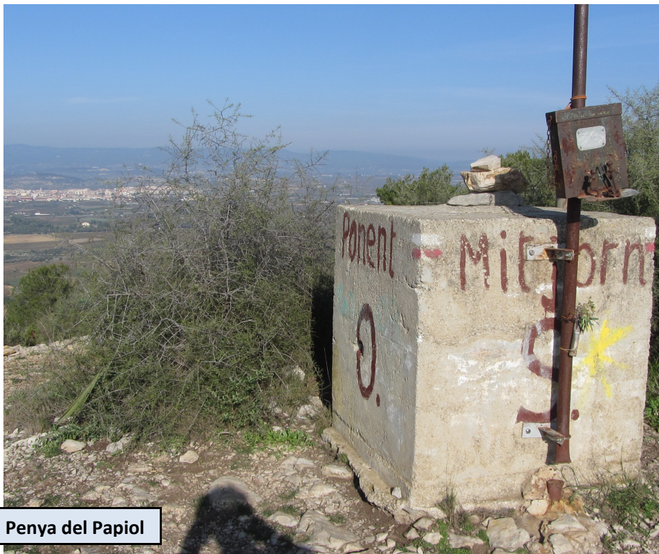
Penya del Papiol