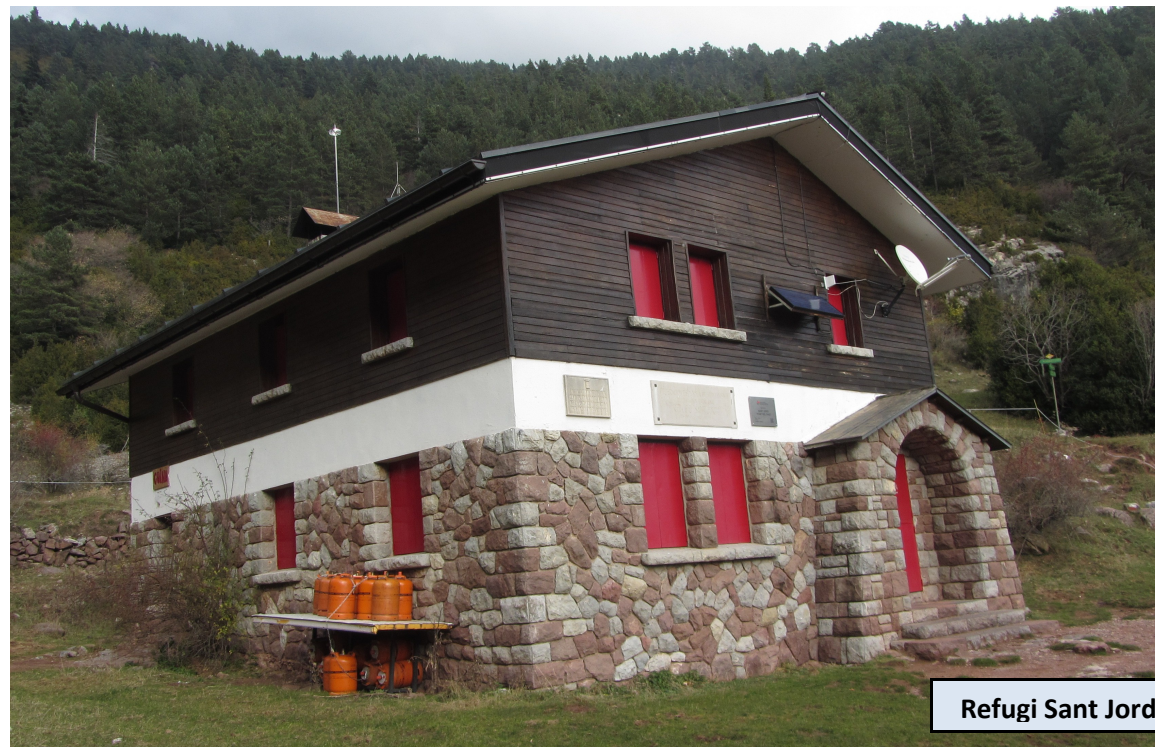
Refugi Sant Jordi

Estético y moderno refugio con placas solares fotovoltaicas. Dispone de 44 plazas y tiene una parte libre de 15 plazas con colchones y en perfecto estado de conservación. Descendemos unos metros siguiendo las marcas del GR, hasta un monumental roble. Encontramos una bifurcación con indicación del camino a seguir. Tomamos el camino de la izquierda, que deja el fondo del valle y se dirige a Grèixer por el GR 107. Descendemos ahora suavemente y caminamos por la ladera sobre el Torrent del Pendís, con grandes vistas al fondo del valle a la derecha y a las paredes del Moixeró por encima nuestro. El descenso se vuelve más acusado y nos lleva hasta Ca n'Escriu (1.300 m. de altura), donde la senda se transforma en pista y empezamos a ganar altura de nuevo. 200 metros de desnivel positivo nos separan del Coll d'Escriu. Podemos alcanzar el collado siguiendo siempre la amplia pista de tierra. Si preferimos ganarlo de manera más directa por sendero, debemos dejar la pista tras las primeras curvas, por un atajo que rompe a la izquierda y que tiene marca de GR. En progresivo ascenso por el interior de un frondoso bosque alcanzaremos el Coll d'Escriu, donde volvemos a salir a la pista.