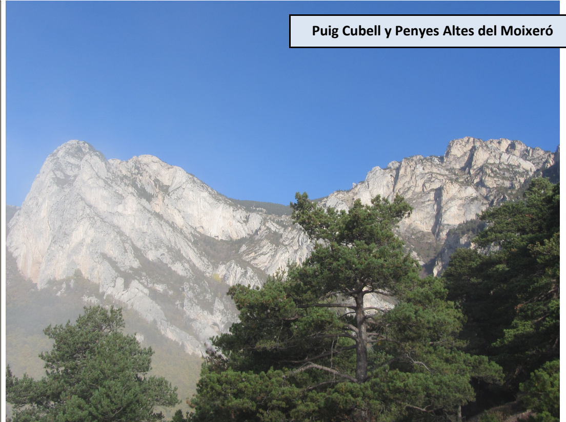
Puig Cubell y Penyes Altes del Moixeró

Ganamos excepcionales vistas a la Cerdanya y a la Serra del Cadí-Moixeró. A la izquierda destaca la cima del Moixeró sobre los prados del Pla de Moixeró. A la derecha seguimos el GR 150 que nos llevará al Penyes Altes del Moixeró. En suave ascenso transitamos primero por herboso terreno y luego nos adentramos en pinares. Seguimos siempre las marcas rojas y blancas del GR y en caso de bifurcación tomamos la senda que ascienda a la derecha. Cerca de la cima encontraremos algún tramo más rocoso e incluso un pequeño y corto paso donde deberemos utilizar un poco las manos para progresar. Sin complicaciones llegamos a la pelada y panorámica cumbre.