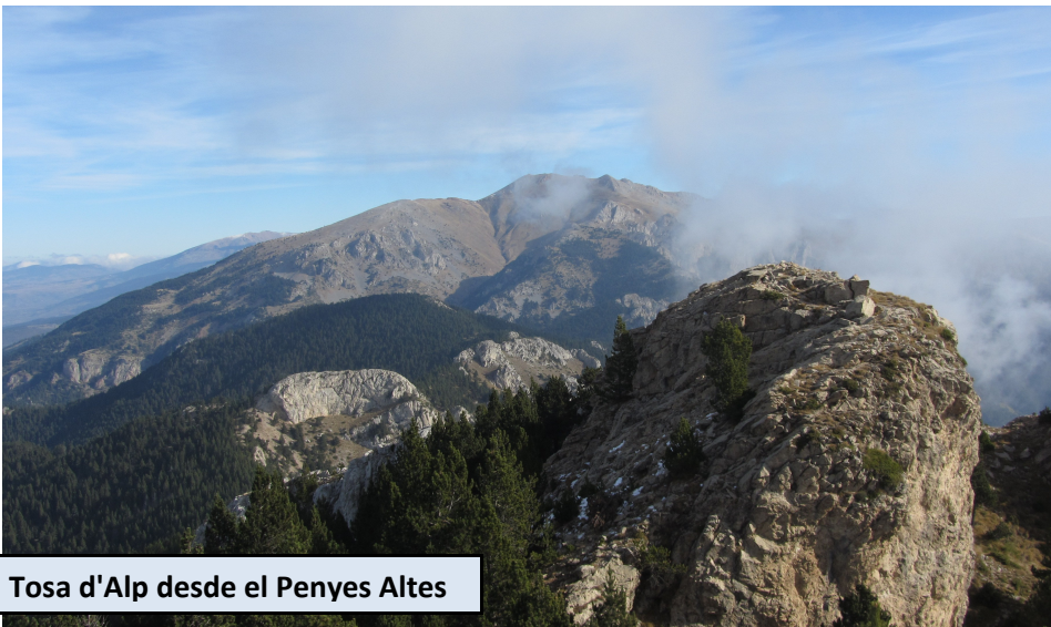
Tosa d'Alp desde el Penyes Altes