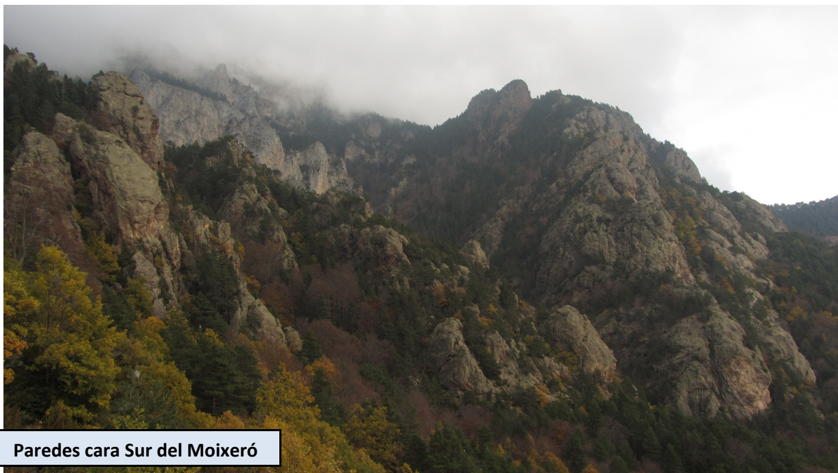
Paredes cara Sur del Moixeró