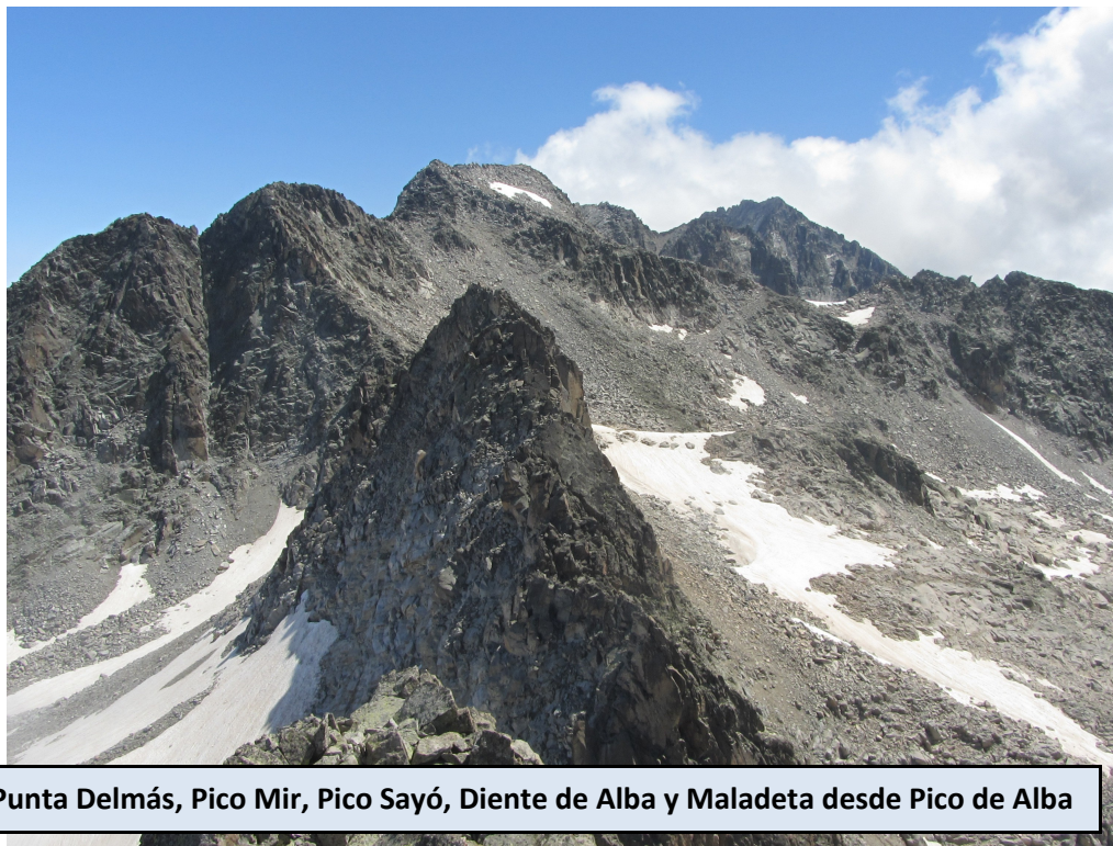
Punta Delmás, Pico Mir, Pico Sayó, Diente de Alba y Maladeta desde Pico de Alba