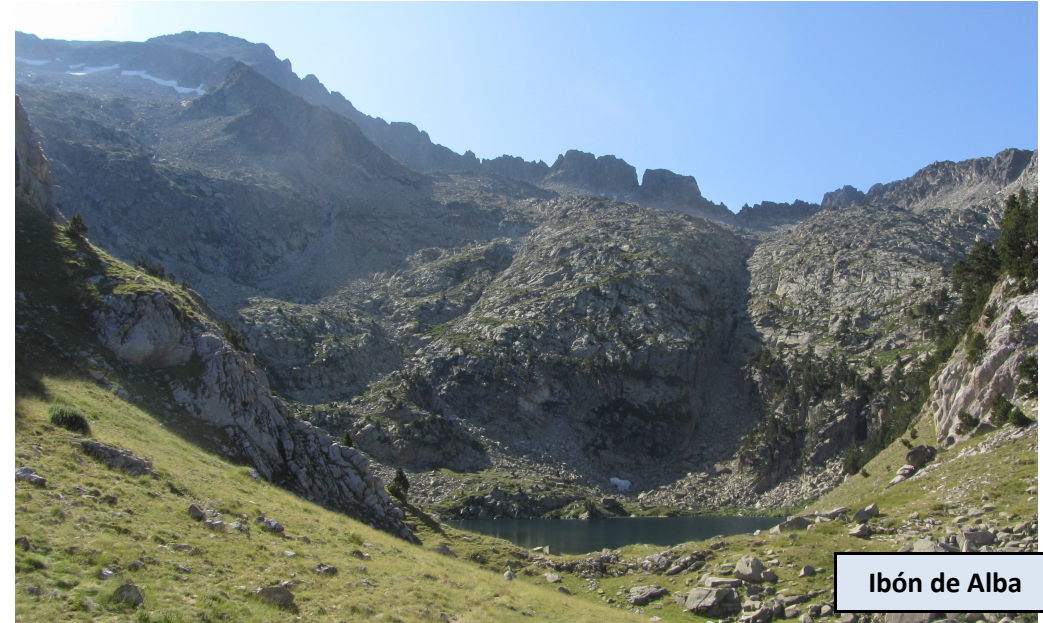
Ibón de Alba

Primero y más bajo de los tres Ibones de Alba. Continuamos ascendiendo por marcada senda, cada vez más pedregosa y con pendiente más pronunciada. No tardamos a llegar al nivel del Ibón Superior de Alba (2.425 m). Desde aquí, en línea recta desde la cabecera del lago, podemos identificar dos brechas muy marcadas en la accidentada Cresta de Alba, la de la derecha corresponde a la Brecha de Alba. Tomamos dirección SE, ganando altura por terreno cada vez más descompuesto e inclinado hasta salir a la Coma de Alba, donde ya divisamos el ascenso final al Pico de Alba y la Cresta de Tuca Blanca. Podemos ganar la cima buscándola directamente o acercarnos hasta la Cresta de Tuca Blanca si queremos avistar la vertiente que da a la Renclusa. En cualquier caso encontraremos hitos que nos guían para encontrar la traza más cómoda. Los últimos metros de ascenso son verticales y descompuestos, por lo que hay que vigilar para no tirar piedras.