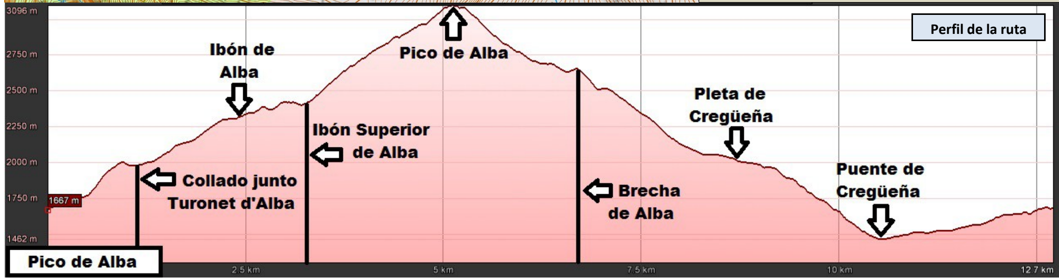
Perfil de la ruta