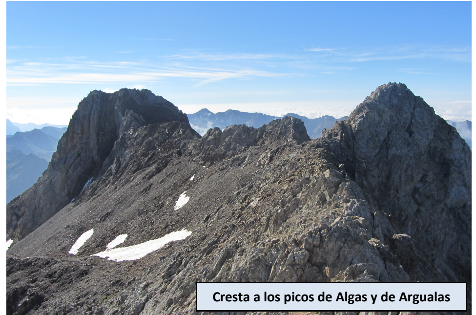
Cresta a los picos de Algas y de Argualas

Estamos frente a un pequeño circo bajo el Argualas, que ya se ve muy por encima nuestro. Podemos subir cruzando la Majada Alta y ascendiendo por una canal, marcada con hitos, o tomar el camino que gira a la derecha y se dirige al Collado de Pondiellos. Recomendamos esta segunda opción por ser el ascenso más suave y progresivo. Un rato después, próximos a la cota de 2.500 metros y en la vertical del Collado de Pondiellos, abandonamos la ruta a este cuello para tomar un camino marcado con hitos que flanquea por debajo de la cara Sur de la Aguja de Pondiellos y del Garmo Negro. A medida que avanzamos se hace más claro el camino por la depresión entre los picos de Algas y Argualas y el Garmo Negro. Ya a más de 2.850 metros, dejamos a la derecha la senda que asciende directamente al Garmo Negro, y avanzamos hacia el Collado Argualas, que ganamos con facilidad. En este tramo podemos encontrar algún nevero aislado, por lo que nos puede convenir el uso de crampones, pero no será lo habitual en verano.