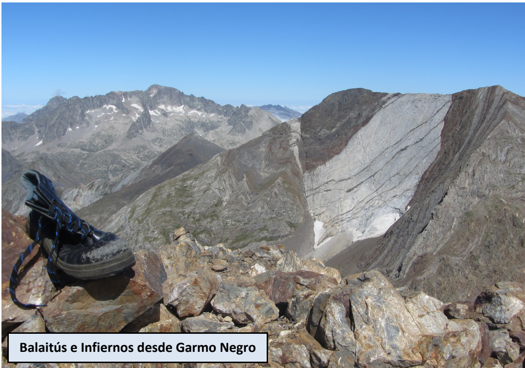
Balaitús e Infiernos desde Garmo Negro