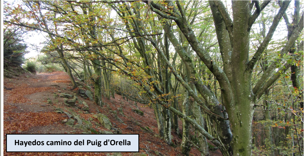
Hayedos camino del Puig d'Orella

Caseta con fuente. Desde aquí podemos ir a la cima por la pista, trazando numerosas vueltas o por una senda que nace al lado de la fuente y que asciende con fuerza. Nuestra reseña asciende por la senda y retorna por la pista. Tomamos la senda, un poco sucia, que va ganando altura. Tras unos 200 metros podremos seguir por una nueva pista que aparece a la derecha o tomar la senda que hace un poco de zig-zag y se eleva hacia la loma cimera del Puig de Sant Cristau. Si optamos por esta segunda opción, más bonita, pronto volveremos a encontrar marcas amarillas que nos indican los puntos más cómodos para transitar por la amplia y rocosa loma. Sin grandes dificultades llegamos a la cima del Puig de Sant Cristau.