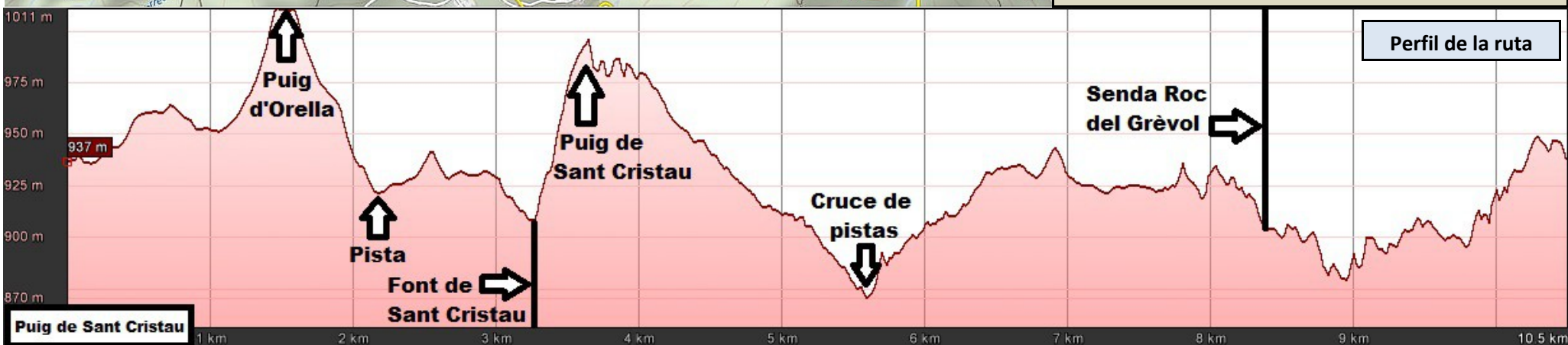
Perfil de la ruta