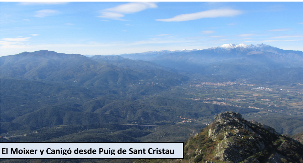
El Moixer y Canigó desde Puig de Sant Cristau