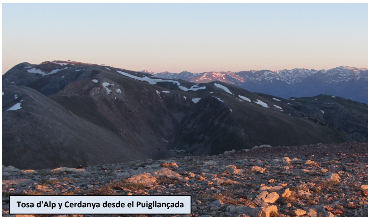
Tosa d'Alp y Cerdanya desde el Puigllançada