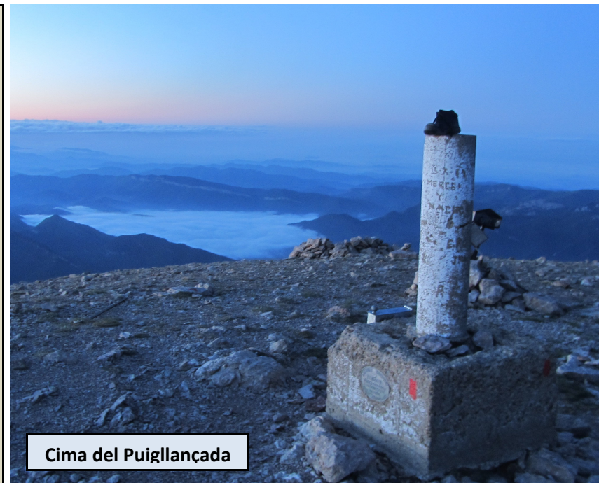
Cima del Puigllançada

Vivac, vértice geodésico y libro de registro. Vistas de 360 grados: Cadí, Pedraforca, Tosa d'Alp, Puigpedrós, Carlit, Puigmal son algunas de las cimas que se ven claramente si el tiempo nos lo permite. Descendemos ahora al otro lado, hacia el NE, buscando una especie de llano por encima de la Costa Geperuda. Desde éste bajamos por los inclinados y cómodos prados de la Costa Geperuda, para dirigirnos a una marcada pista de tierra que hay en la depresión debajo nuestro a la izquierda de la Collada de les Tortes. Durante la bajada localizamos una traza diagonal que asciende desde la pista de tierra a la loma cimera del Tossal de Rus, por la vertiente izquierda de esta cima, para dirigirnos a donde empieza y subir por ella de manera más cómoda y progresiva. Llegando a la amplia arista cimera, esta traza desaparece y debemos girar a la derecha ascendiendo por donde nos sea más cómodo hasta el punto más alto.