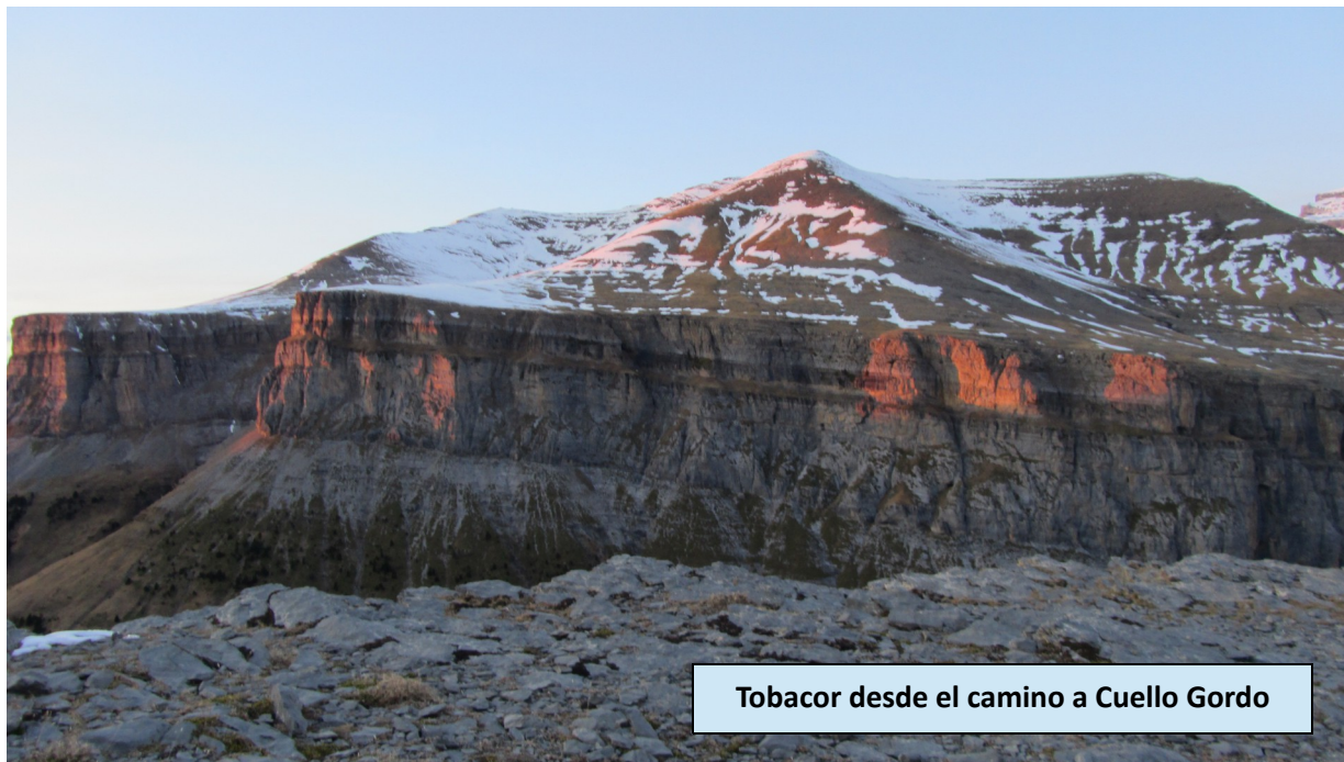
Tobacor desde el camino a Cuello Gordo

8:00 horas - Final de la ruta. ¡Nos recoge el autobús y a casa!