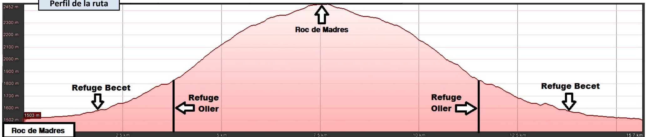
Perfil de la ruta

Nota: Los horarios varían mucho según las condiciones de innivación. El horario reseñado es para unas condiciones óptimas de nieve, donde las raquetas fueron usadas en menos de la mitad del recorrido y cuando se usaron se caminaba con comodidad.