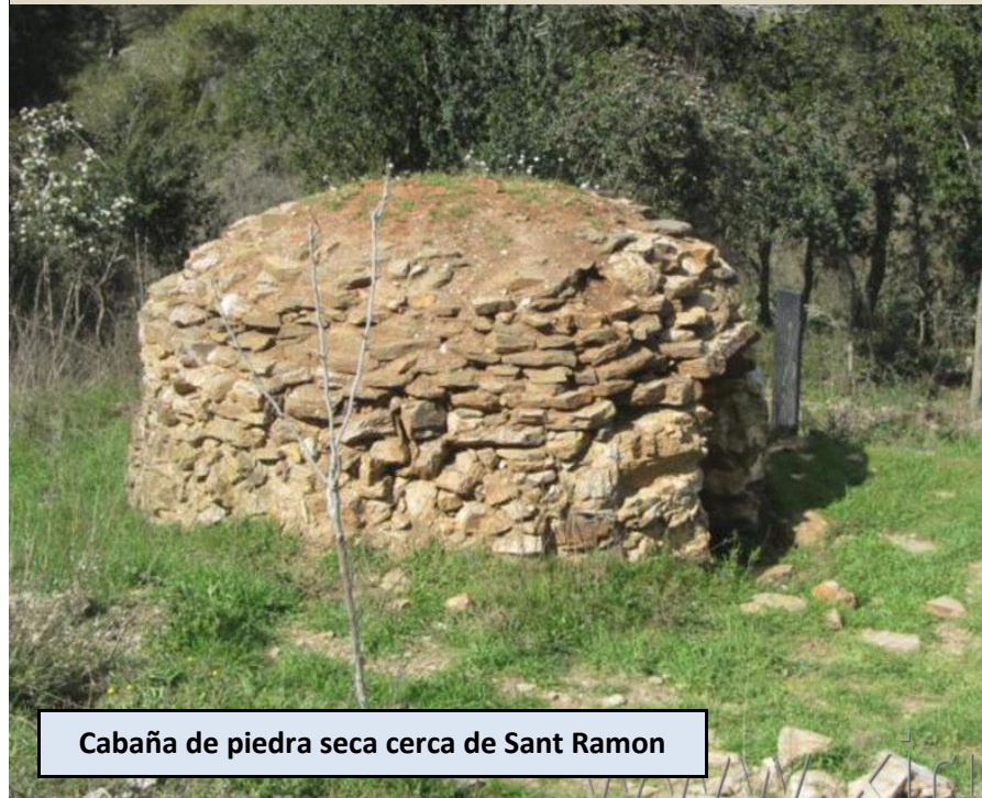
Cabaña de piedra seca cerca de Sant Ramon