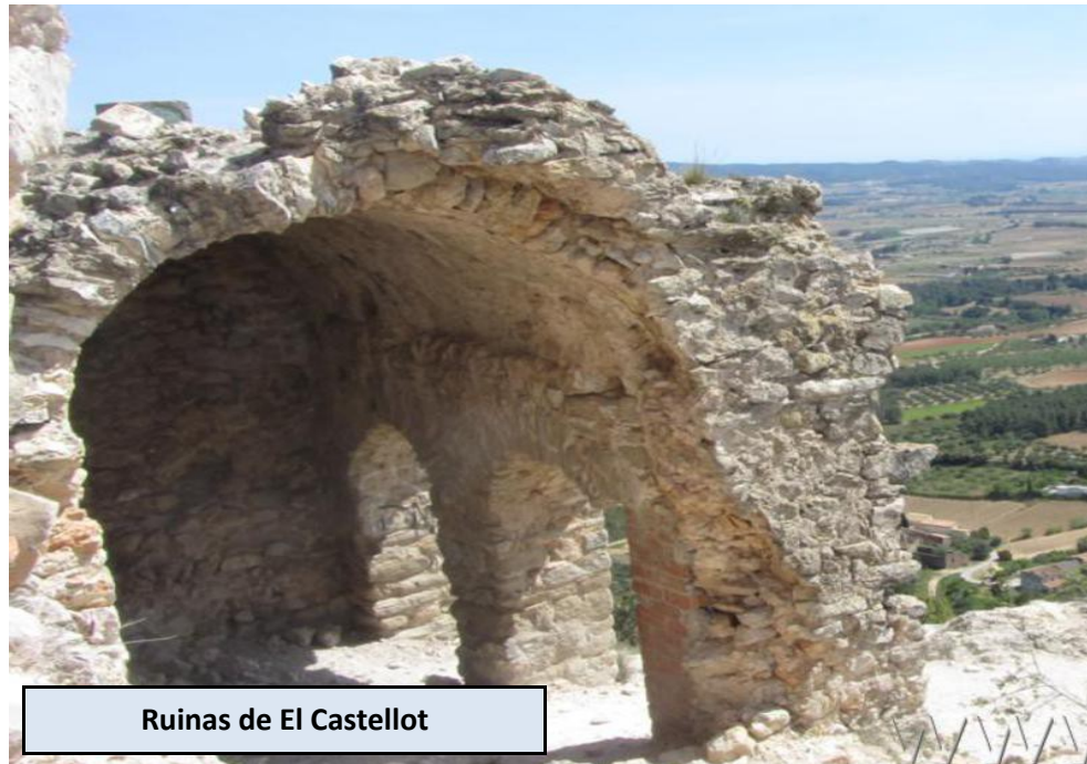
Ruinas de El Castellot