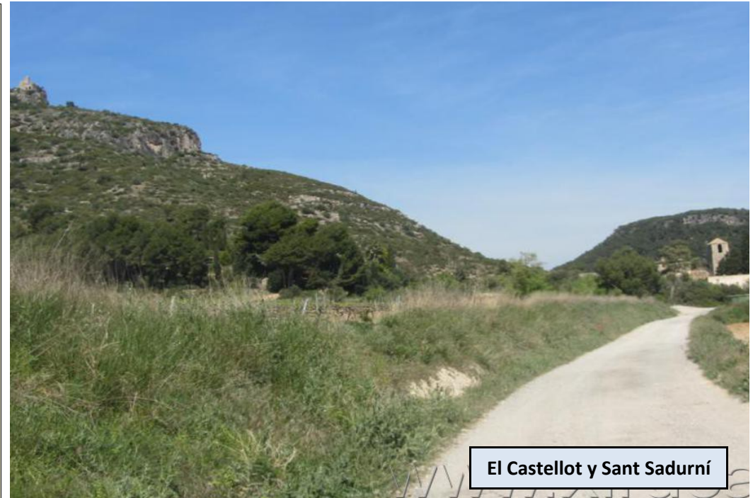
El Castellot y Sant Sadurní

Seguimos ahora por la pista asfaltada hacia la derecha, hasta llegar a un grupo de casas, las Casetes de Gomila, donde tomaremos la pista de tierra, que va subiendo de manera moderada hasta llevarnos a El Castellot. Encontraremos diversas desviaciones, nosotros seguiremos siempre por el camino principal.