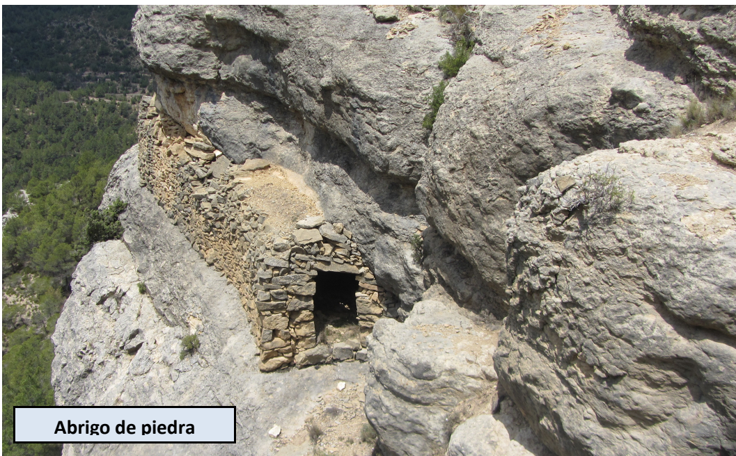
Abrigo de piedra