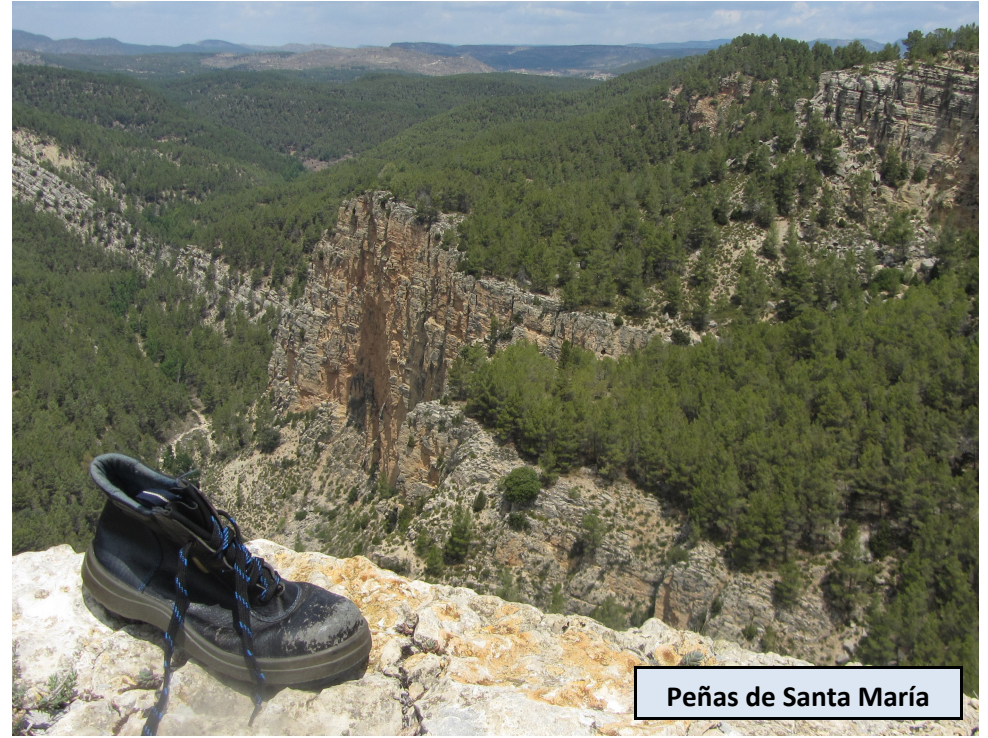
Peñas de Santa María

Aquí deberemos seguir la pista durante unos pocos metros, hasta llegar a un lugar donde empieza una pronunciada subida y en el que tenemos una barraca de piedra a la izquierda de la pista. Aquí tenemos bien indicada, con un poste y con marcas de GR (rojas y blancas), el sendero que debemos tomar hacia la derecha para llegar a las Peñas de Santa María.