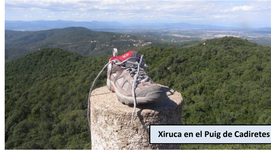
Xiruca en el Puig de Cadiretes

Ahora nos desviamos por la pista que sale a la izquierda, con indicación del "Puig de ses Cadiretes". En menos de 5 minutos llegaremos a otro indicador que nos saca de la pista por un caminito a la izquierda que se interna en un bosque y que en menos de 5 minutos nos deja en la cima del Puig de Cadiretes.