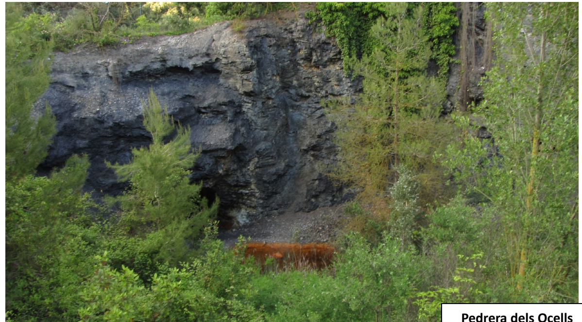
Pedrera dels Ocells

Espacio naturalista curioso y estético, con unas paredes de pizarra que llaman bastante la atención y unos charcos de aguas de color rojizo. Podemos oír el canto de diversos pájaros si no hacemos ruido y prestamos atención. Desde aquí volvemos al punto inicial en un par de minutos más.