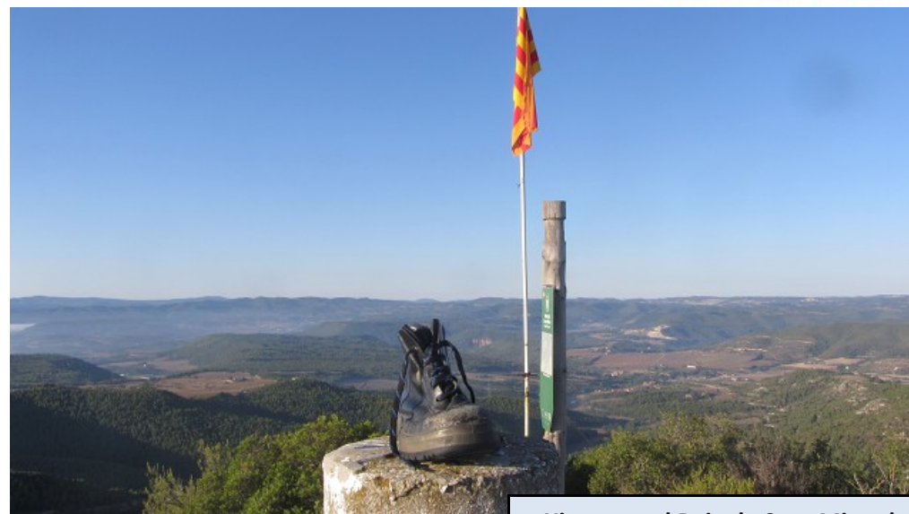
Xiruca en el Puig de Sant Miquel

Aquí ya divisamos el Puig de Sant Miquel. En vez de subir directamente a él, seguiremos por la pista en dirección a la derecha para ver la ermita de Sant Pere d'Ardesa.