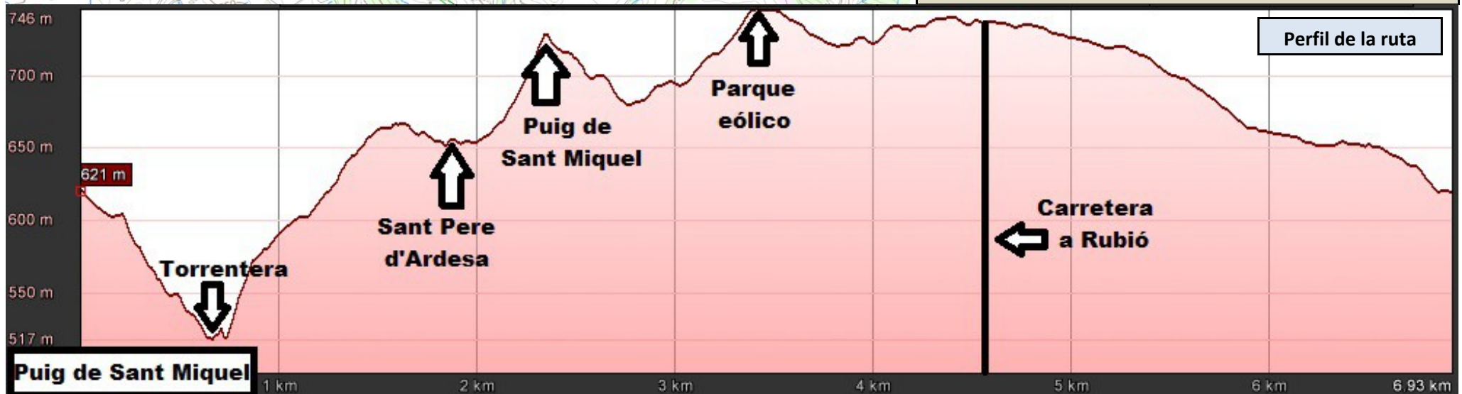
Perfil de la ruta