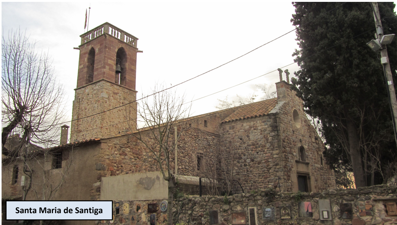
Santa Maria de Santiga