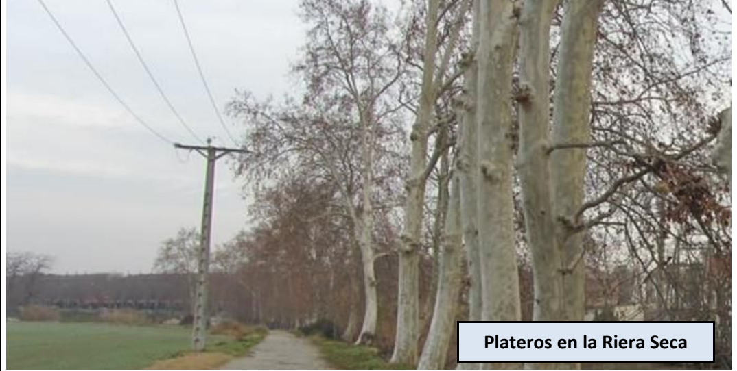
Plateros en la Riera Seca

Cruzamos la carretera y nos dirigimos a la parada de autobús, en dirección a Barcelona. Giramos por el Carrer de Sant Pau a mano derecha, siguiéndolo hasta llegar al final del mismo. Hallaremos un puente por donde discurre la línea de ferrocarril Barcelona-Puigcerdà. Pasamos bajo el mismo y cruzamos la riera. Seguiremos ahora en paralelo a la Riera Seca en dirección N, por el margen derecho del extenso Pla d'Albinyana. El camino comienza a girar hacia el Oeste, hasta llegar a la confluencia de la Riera Seca con la Riera de Polinyà. En este punto abandonamos el amplio camino para entrar a la Riera Seca y avanzar unos metros "aguas arriba" por el mismo cauce, normalmente seco, hasta encontrar una traza por la que podemos subir a la derecha a una calle del "Polígon Industrial Camp de les Pereres". Avanzamos ahora en paralelo a la riera, a nuestra izquierda (dirección O-NO), hasta llegar al final de la zona asfaltada. En este punto un poste indicador señala la pista que va separándose de la riera y se dirige directamente al Castell de Can Taió. Apenas 500 metros lo separan de nuestra posición, situado justo después de pasar el túnel bajo la línea de Ferrocarril Mollet del Valles-El Papiol.