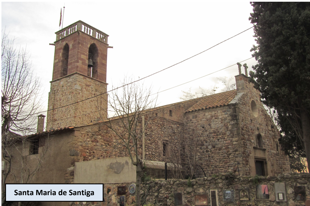
Santa Maria de Santiga