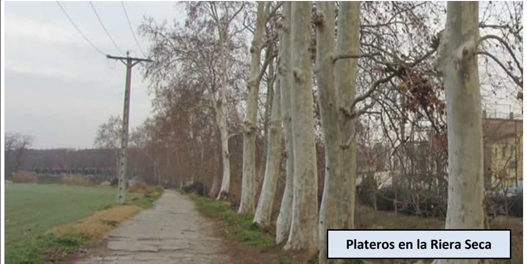
Plateros en la Riera Seca

Cruzamos la carretera y nos dirigimos a la parada de autobús, en dirección a Barcelona. Giramos por el Carrer de Sant Pau a mano derecha, siguiéndolo hasta llegar al final del mismo. Hallaremos un puente por donde discurre la línea de ferrocarril Barcelona-Puigcerdà. Pasamos bajo el mismo y cruzamos la riera. Seguiremos ahora en paralelo a la Riera Seca en dirección N, por el margen derecho del extenso Pla d'Albinyana. El camino comienza a girar hacia el Oeste, hasta llegar a la confluencia de la Riera Seca con la Riera de Polinyà. En este punto abandonamos el amplio camino para entrar a la Riera Seca y avanzar unos metros "aguas arriba" por el mismo cauce, normalmente seco, hasta encontrar una traza por la que podemos subir a la derecha a una calle del "Polígon Industrial Camp de les Pereres". Avanzamos ahora en paralelo a la riera, a nuestra izquierda (dirección O-NO), hasta llegar al final de la zona asfaltada. En este punto un poste indicador señala la pista que va separándose de la riera y se dirige directamente al Castell de Can Taió. Apenas 500 metros lo separan de nuestra posición, situado justo después de pasar el túnel bajo la línea de Ferrocarril Mollet del Valles-El Papiol.