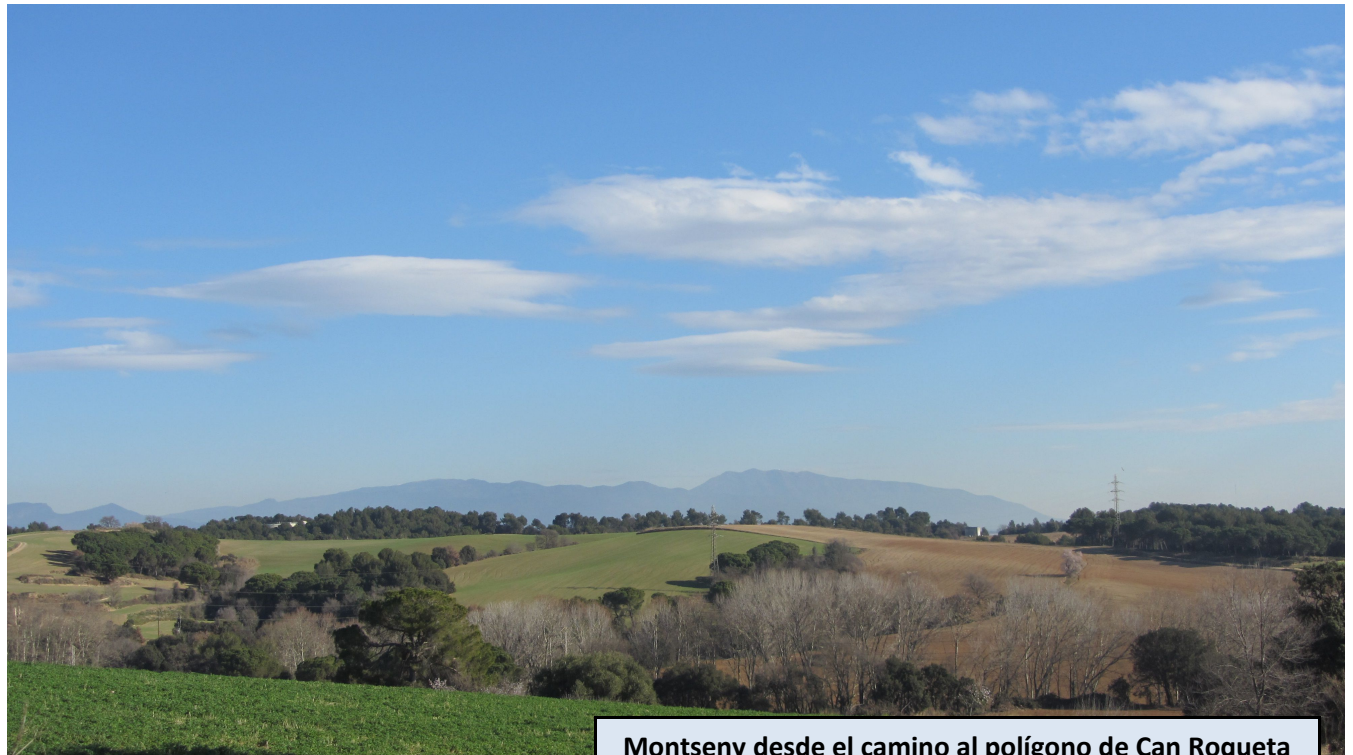
Montseny desde el camino al polígono de Can Roqueta