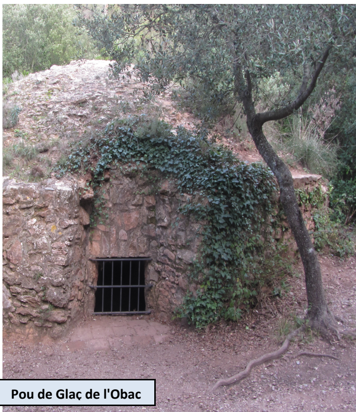
Pou de Glaç de l'Obac