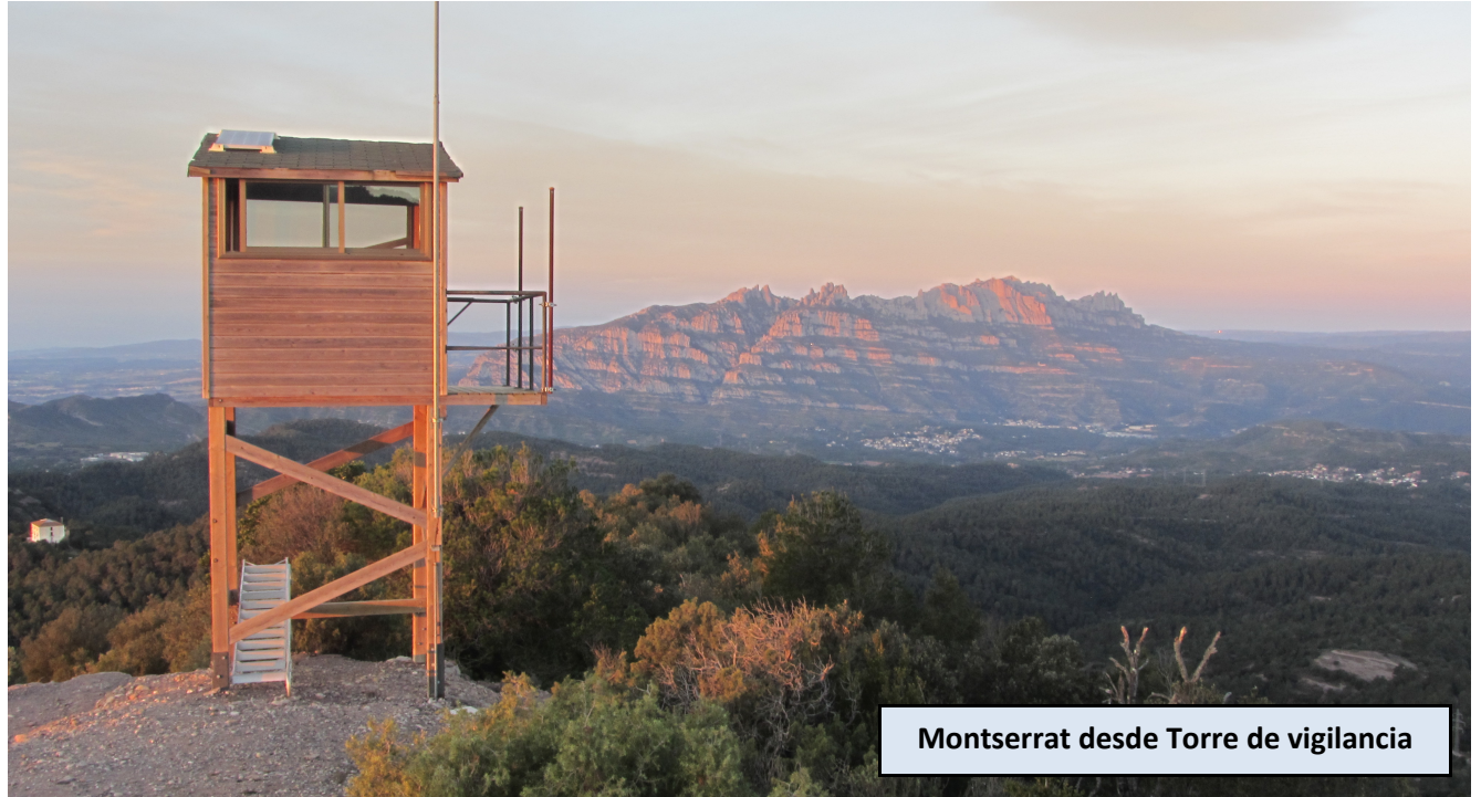
Montserrat desde Torre de vigilancia

Desde el área de estacionamiento ascendemos a la Casa Nova de l'Obac. En ella, masia del siglo XIX con influencias italianas en su fachada, hallamos un punto de información del Parc Natural de Sant Llorenç del Munt i l'Obac. Progresamos hasta el cercano restaurante de La Pastora, delante del cual salen dos caminos, uno a derecha y otro a izquierda. Tomamos la pista de la derecha que avanza bajo la loma de Alts de la Pepa. 800 metros más adelante, al poco de pasar una torre de alta tensión, hallamos una senda un poco desdibujada que rompe a la izquierda. Dejamos la pista que nos llevaría a la Torrota de l'Obac y tomamos el sendero a la izquierda para dirigirnos a la Serra del Pou. Tras un tramo donde la pendiente gana un poco de fuerza salimos a un claro con una torre de vigilancia, junto al Turó de la Mamella.