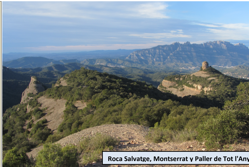
Roca Salvatge, Montserrat y Paller de Tot l'Any

Redondeada y amplia cima, con vértice geodésico. Nuevas perspectivas sobre Montserrat, la ruta recorrida y el cilíndrico Paller de Tot l'Any, al que nos dirigiremos ahora. Retornamos al Coll de les Tres Creus por la pista forestal, donde tomaremos el GR 5 en descenso. Sin dejar el GR 5 pasamos por el otro lado del Castellsapera y sobre la Canal de Mura. Obviamos los diversos desvíos que nos van apareciendo a la izquierda hasta que, pasado el Collet del Forn Gran, localizamos uno marcado con hitos que asciende hasta conducirnos a la base del Paller de Tot l'Any.