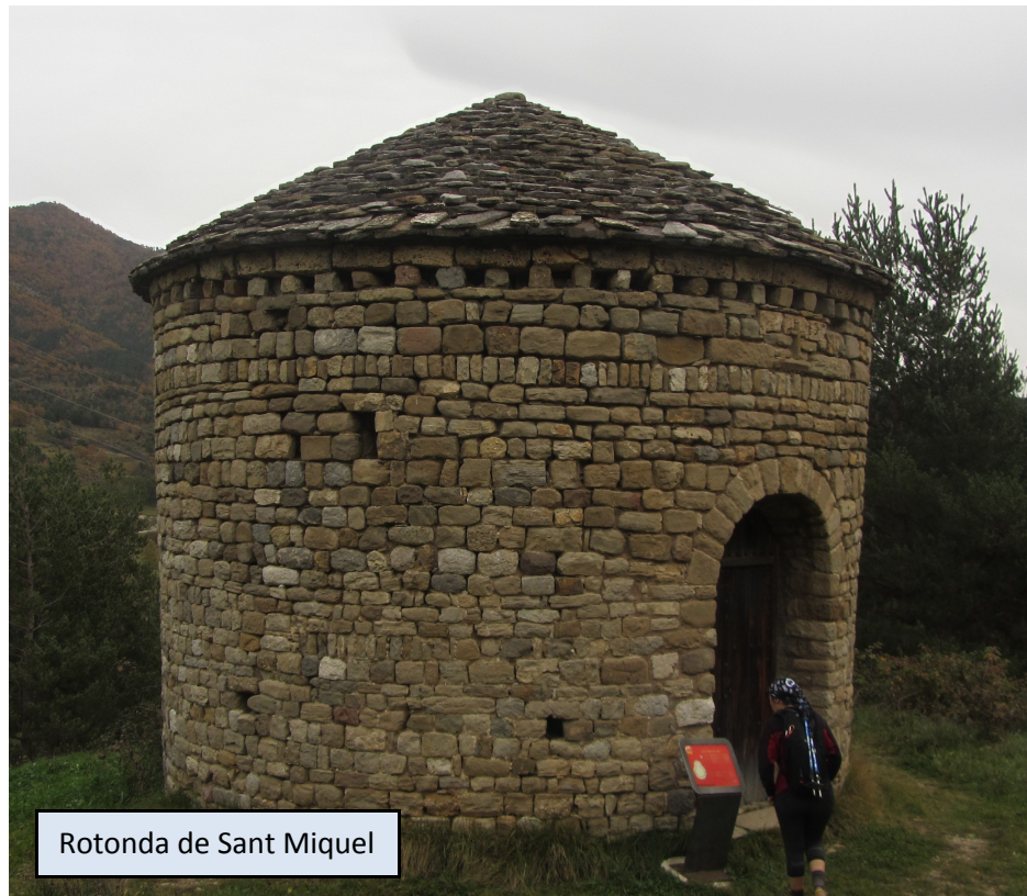
Rotonda de Sant Miquel