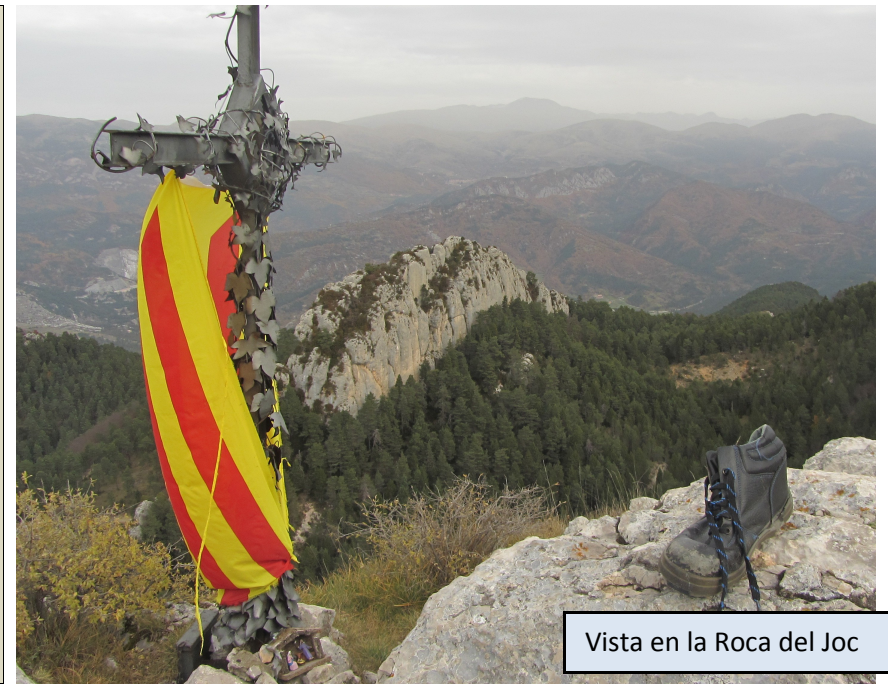
Vista en la Roca del Joc

Cima con una cruz y una Virgen de Montserrat, con increíble sensación de elevación sobre el terreno circundante. Buena vista de 360 grados a las cimas próximas. Destrepamos por el mismo itinerario, con cuidado, y retornamos hasta el haya monumental. Seguimos nuevamente el PR que nos conducirá a la pista forestal, pero ahora más adelante, frente a las Roques d'Arderiu. Por cómoda pista perdemos altura hasta llegar al Collet Fred. Allí encontramos indicaciones al mirador y un sendero a la izquierda, que nos conduce hasta la cima de la Roca de la Lluna, probablemente el mirador más conocido y transitado de la zona.