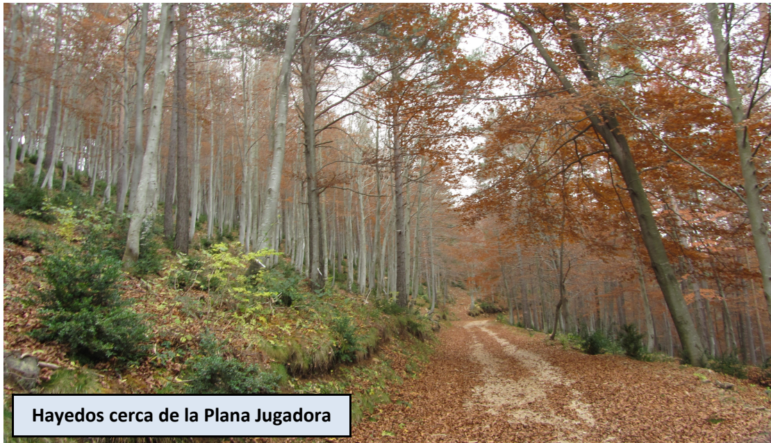
Hayedos cerca de la Plana Jugadora