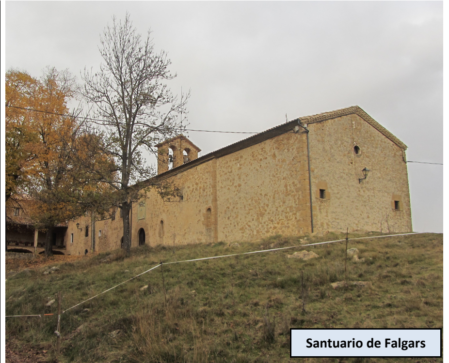
Santuario de Falgars

Santuario y hotel rural. La iglesia es del 1646, aunque la original data del 1049. En su interior se encuentra la talla de la Mare de Déu de Falgars, una imagen gótica de la virgen María que está amamantando a su hijo. Tomamos la pista asfaltada que desciende hasta la Collada de Falgars, donde hay un cruce de caminos. En éste, dejamos la pista y tomamos el sendero que se inicia junto a un monolito de piedra, prosiguiendo por el GR4. Nos adentramos en espesos hayedos y ascendemos en dirección SO, prestando atención en los sucesivos cruces a mantener dicha dirección. Poco a poco vamos sustituyendo hayedos por pinares. Superada la cota de 1.450 metros nuestra ruta llega al Clot de l'Infern, donde confluye con el PR C-129, que tomamos en dirección al Camp de l'Ermità.