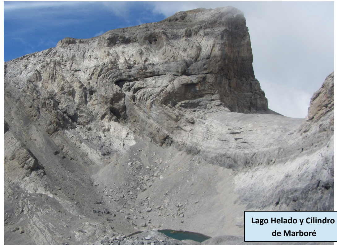
Lago Helado y Cilindro de Marboré