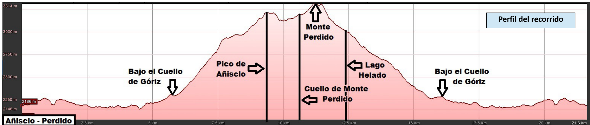
Perfil del recorrido