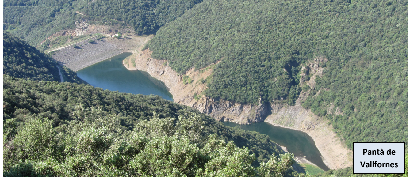
Pantà de Vallfornes

Partimos por la misma pista que nos ha traído hasta aquí, en moderado ascenso hacia el Pantà de Vallfornes. Obviamos el desvío a la derecha que se nos presenta a los pocos metros hacia Can Cuch. Sin dejar la misma, nos iremos elevando hasta alcanzar la cabecera del pantano. Luego continuaremos por la pista, a la derecha del pantano, por terreno casi llano. En cosa de un par de kilómetros, a la altura del final del pantano, hallamos otra bifurcación. En ella tomaremos el desvío a la derecha, para internarnos en el sombrío y amplio camino que remonta el Torrent de la Baga d'en Cuc. Este es el tramo con el ascenso más pronunciado. Seguiremos siempre por pista y en las bifurcaciones hallaremos rótulos que nos guiarán hasta el mismo Castanyer de Can Cuch.