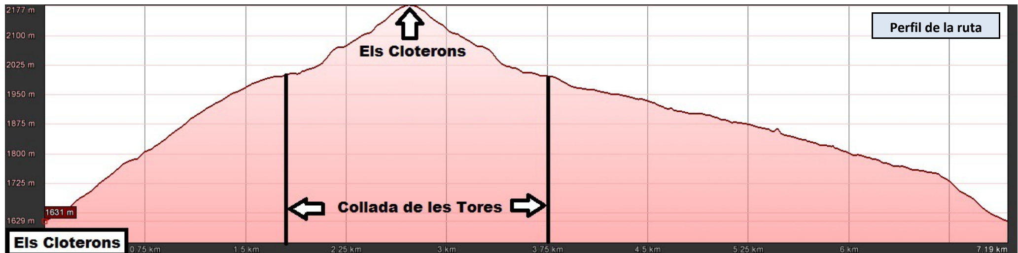
Perfil de la ruta