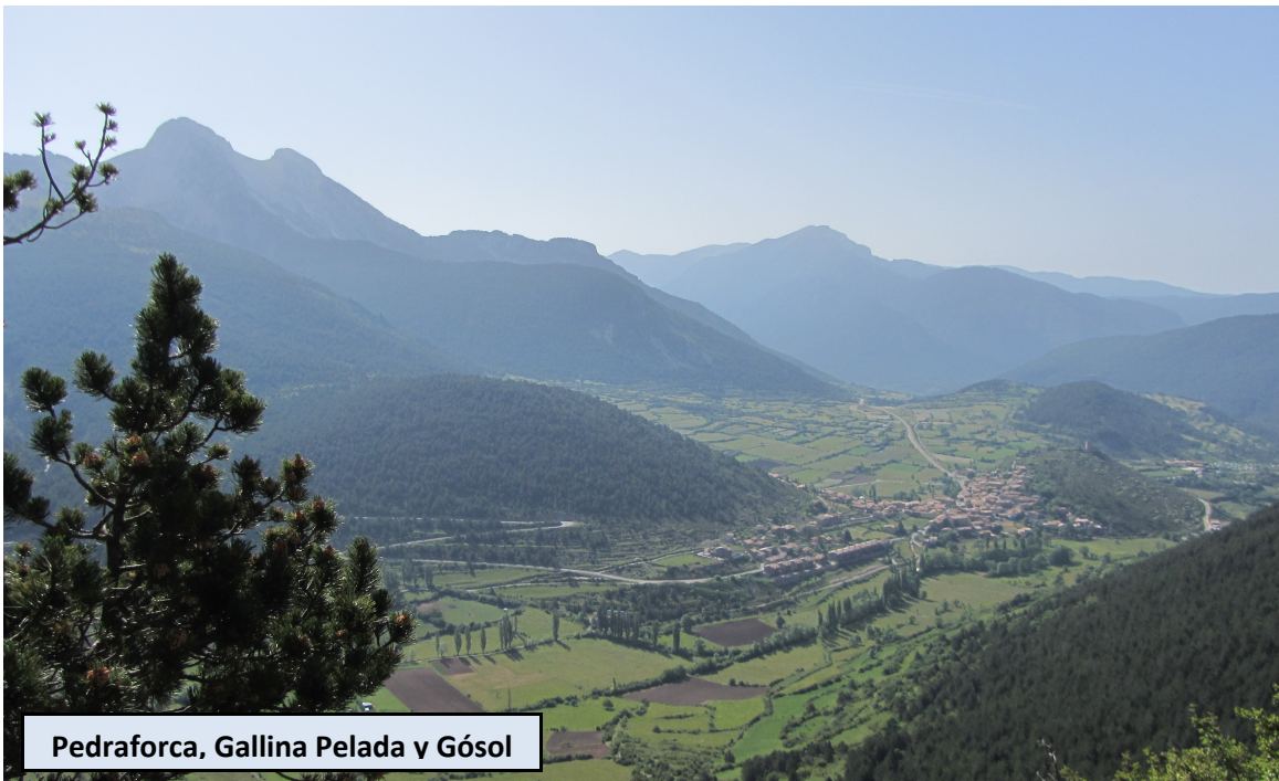
Pedraforca, Gallina Pelada y Gósol