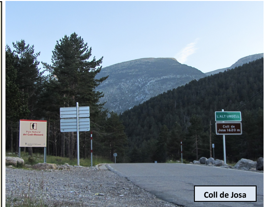
Coll de Josa

Tranquilo llano, donde dejaremos la pista para dirigirnos a la cima de Els Cloterons. El camino no está muy definido y los hitos son difusos y difíciles de seguir. Debemos seguir siempre en ascenso en dirección SO, procurando avanzar por las trazas más cómodas. No nos llevará demasiado tiempo alcanzar la cima, probablemente menos de 30 minutos desde la collada.