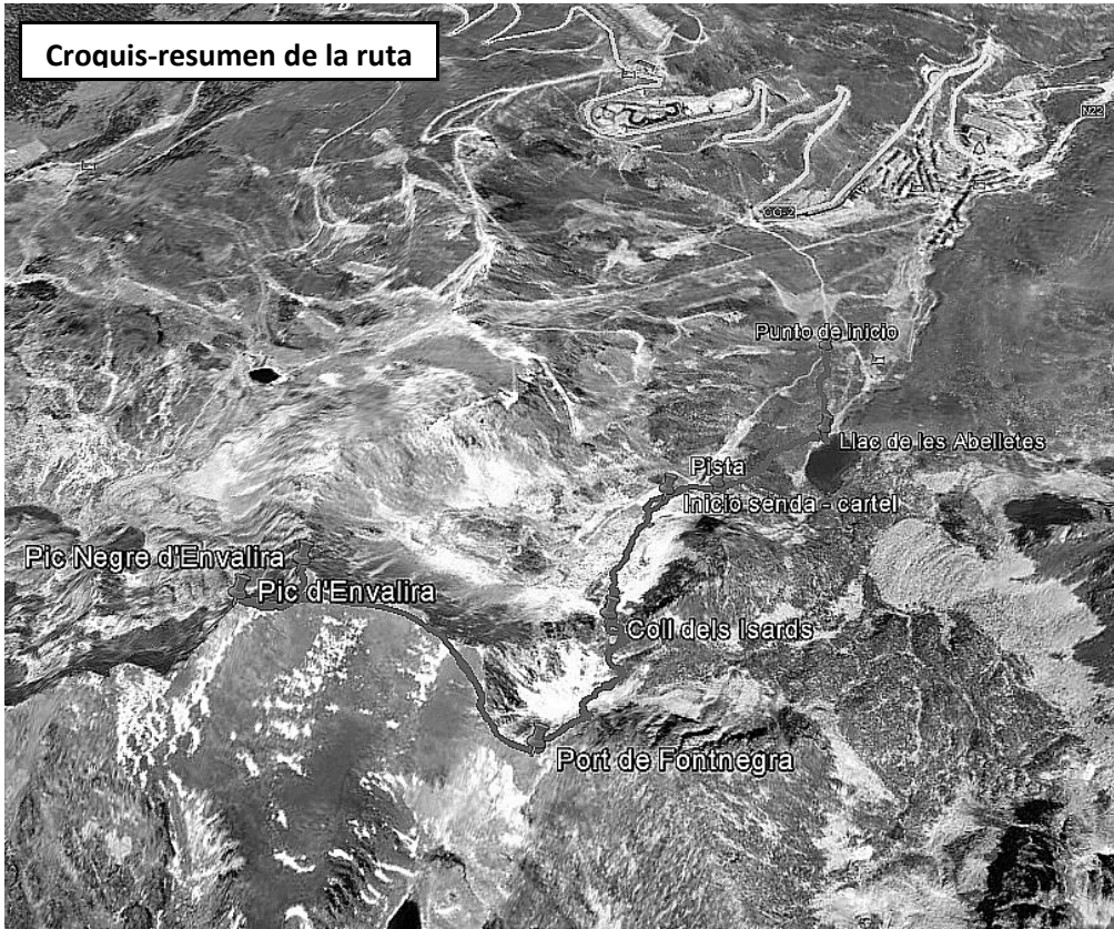
Croquis-resumen de la ruta

Sencilla excursión de alta montaña a dos picos gemelos andorranos, el Pic Negre d'Envalira y el Pic d'Envalira, con magníficas vistas y sin dificultad de orientación.