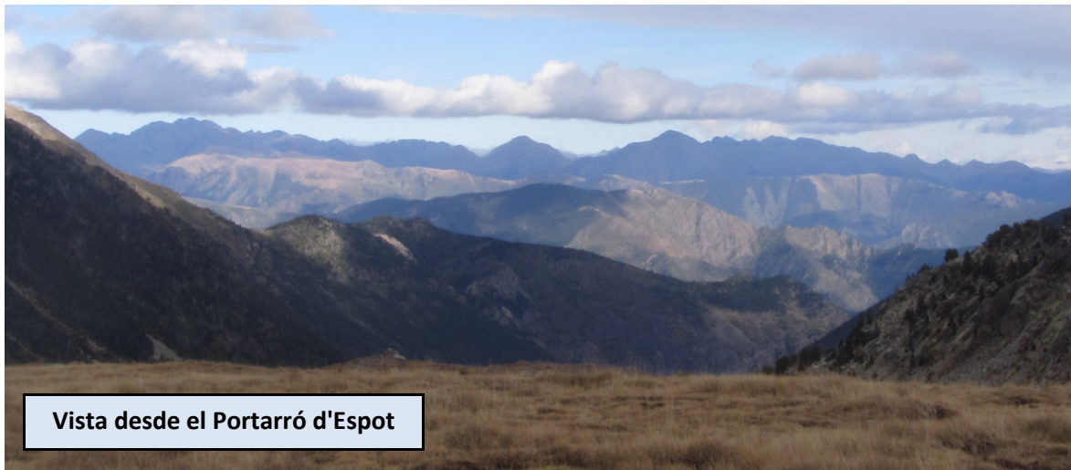
Vista desde el Portarró d'Espot