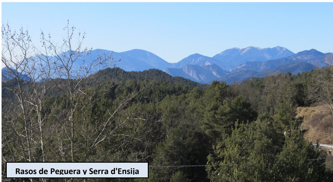
Rasos de Peguera y Serra d'Ensija