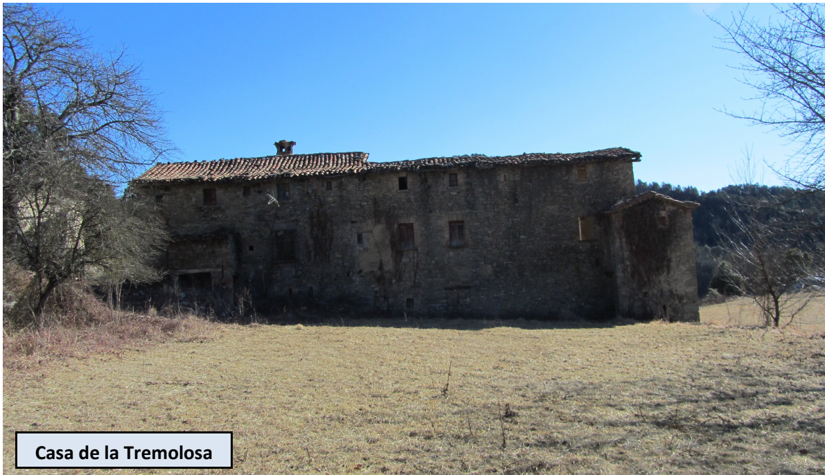
Casa de la Tremolosa