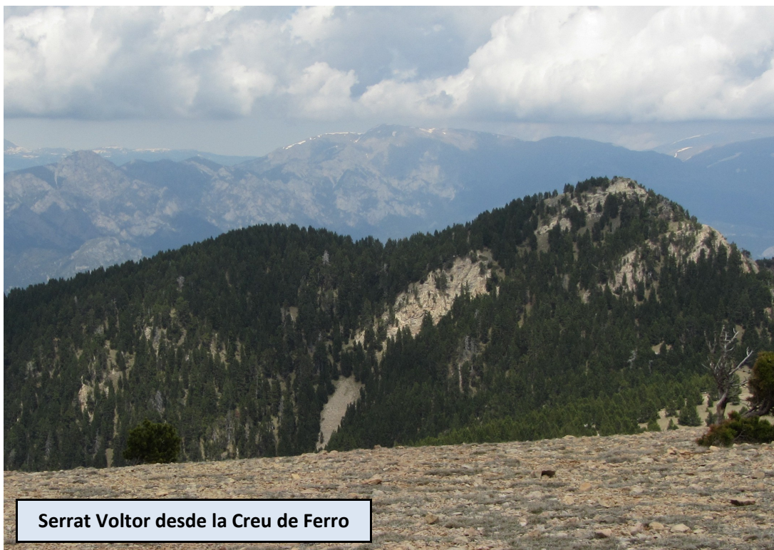
Serrat Voltor desde la Creu de Ferro