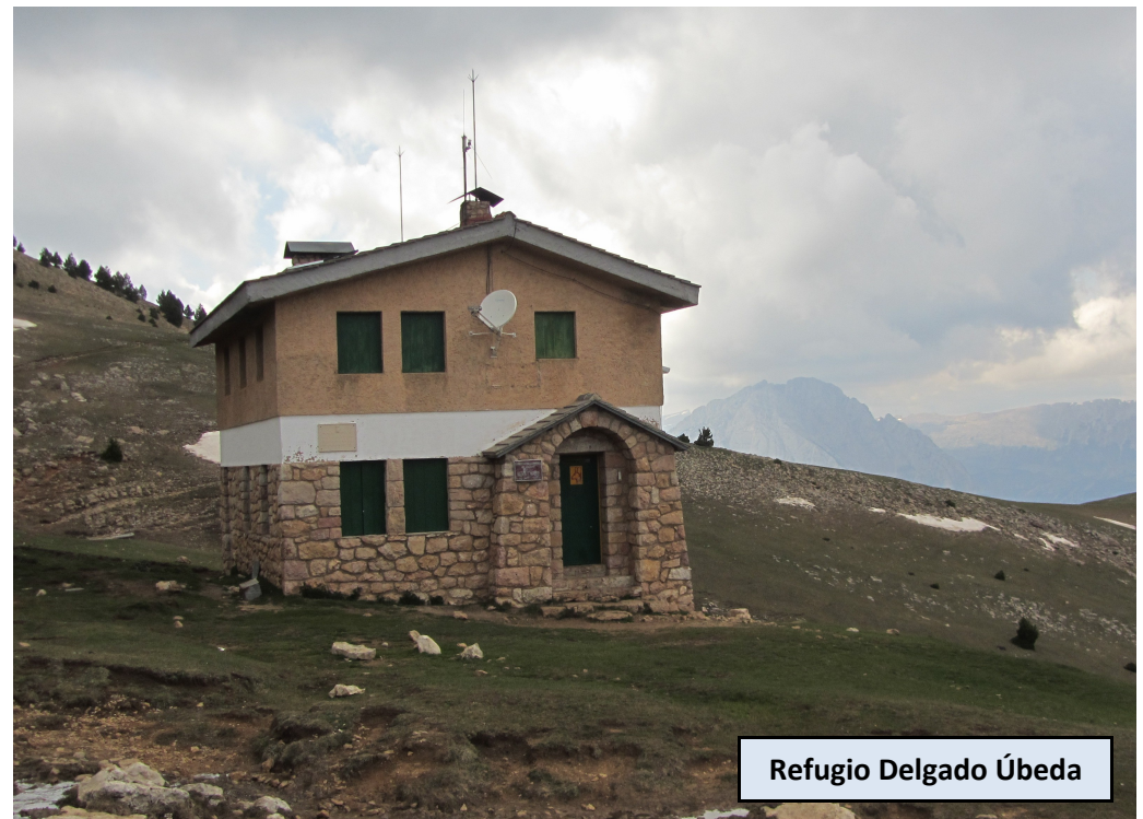
Refugio Delgado Úbeda

Refugio guardado, con parte libre con capacidad para unas 2 personas en ausencia del guarda. Abrevadero y fuente en las cercanías. Seguimos la marcada senda hacia el Oeste que asciende sin grandes esfuerzos a la cima de Cap Llitzet o Cap de la Gallina Pelada.