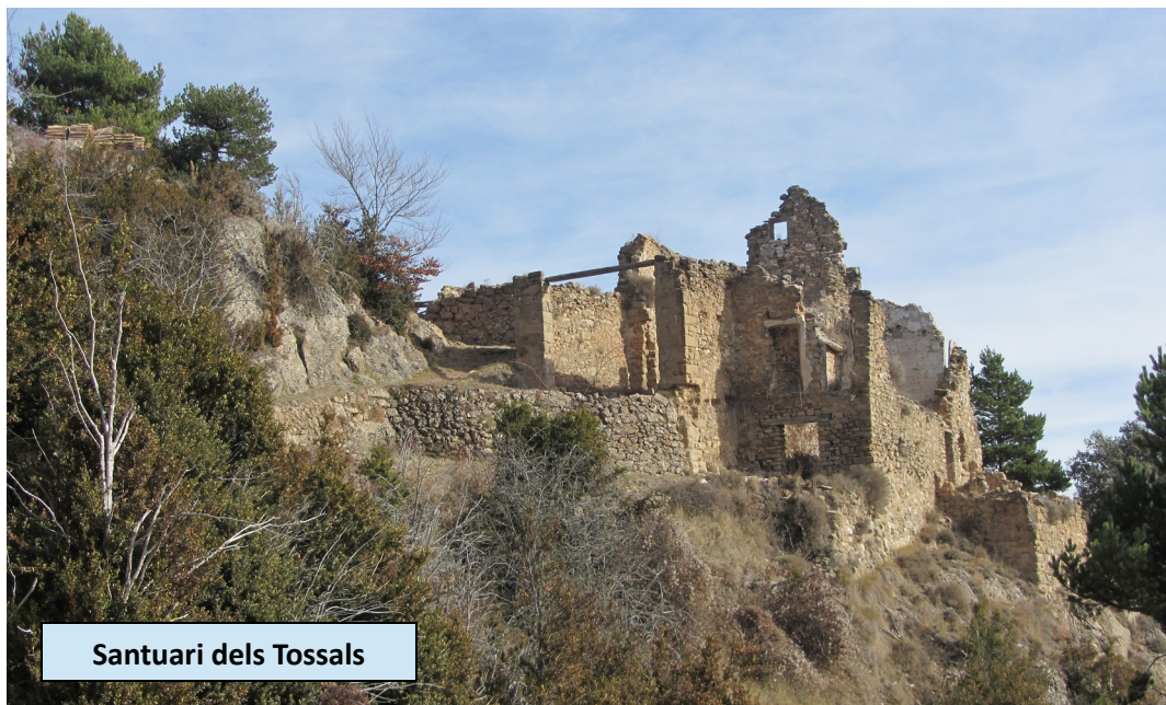
Santuari dels Tossals