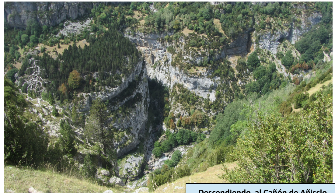
Descendiendo al Cañón de Añisclo