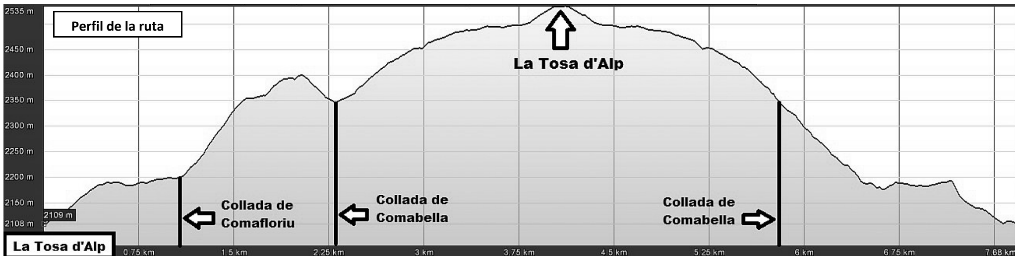
Perfil de la ruta