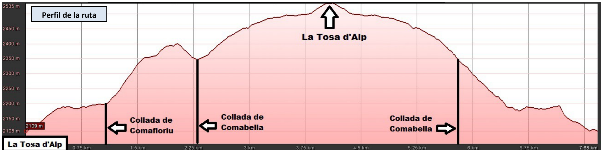
Perfil de la ruta