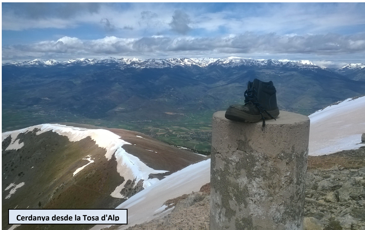
Cerdanya desde la Tosa d'Alp