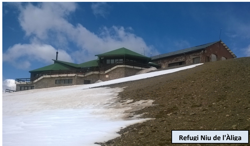
Refugi Niu de l'Àliga

Hemos ganado ya la larga y sencilla arista que nos conducirá hasta la cima de la Tosa. Simplemente la seguimos, en suave ascenso al principio y luego casi en llano, hasta llegar frente al Refugi del Niu de l'Àliga. En las proximidades encontramos el telecabina Alp 2500, una gran antena de telecomunicaciones y el vértice geodésico de la cima, que no dista mucho más de 100 metros del refugio.