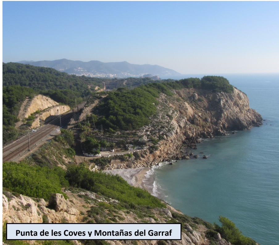
Punta de les Coves y Montañas del Garraf