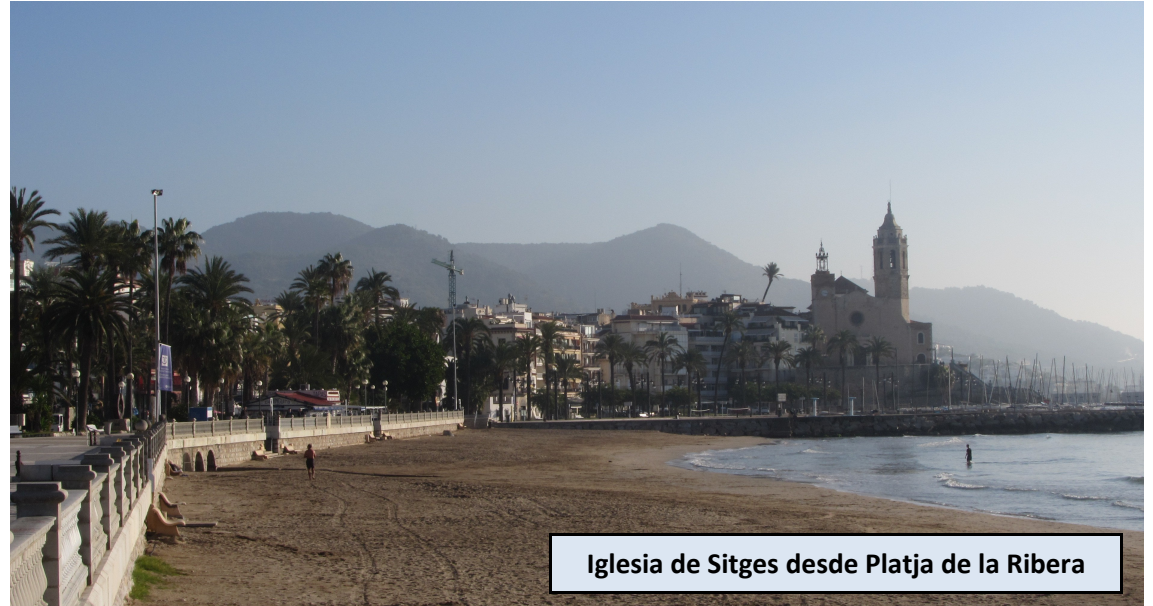
Iglesia de Sitges desde Platja de la Ribera

Unos metros nos separan de la amplia desembocadura de la Riera de Ribes. Proseguimos por primera línea de costa. En 300 metros, aproximadamente, saldremos a una deteriorada pista asfaltada. Mantenemos dirección para pasar tras los locales de l'Atlàntida. Allí comienza el sendero que se dirige a la Punta de les Coves. Desde aquí nuestra ruta transitará por pedregosos caminos, entre diversas playas a nuestra izquierda y la línea del tren a nuestra derecha. Pasaremos tres puntas diferentes, en este orden: Punta de les Coves, Punta de la Desenrocada y Punta Grossa. Antes de llegar a cada una de ellas ascenderemos unos metros que volvemos a descender al traspasarlas.