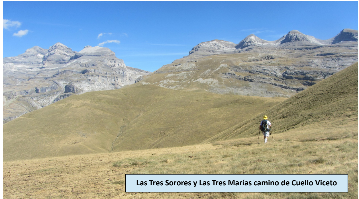
Las Tres Sorores y Las Tres Marías camino de Cuello Viceto