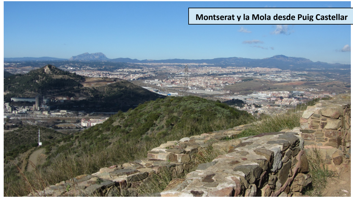
Montserrat y la Mola desde Puig Castellar

Cuando estamos al otro lado, próximos a una rotonda a la salida del pueblo, proseguimos por la ribera del Besòs en dirección a Sant Adrià. Estamos en el Parc Fluvial del Besòs, una zona donde se ha rehabilitado el río, adecuándolo y limpiándolo, de manera que se han recuperado numerosas especies animales y se han creado caminos de paseo y un transitado carril bici. Pasamos por al lado de una fuente y unos metros más adelante, justo antes de llegar a la Depuradora de Montcada, encontramos un poste indicador.