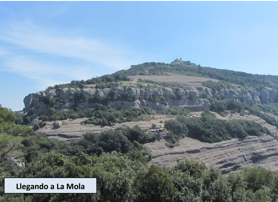
Llegando a La Mola