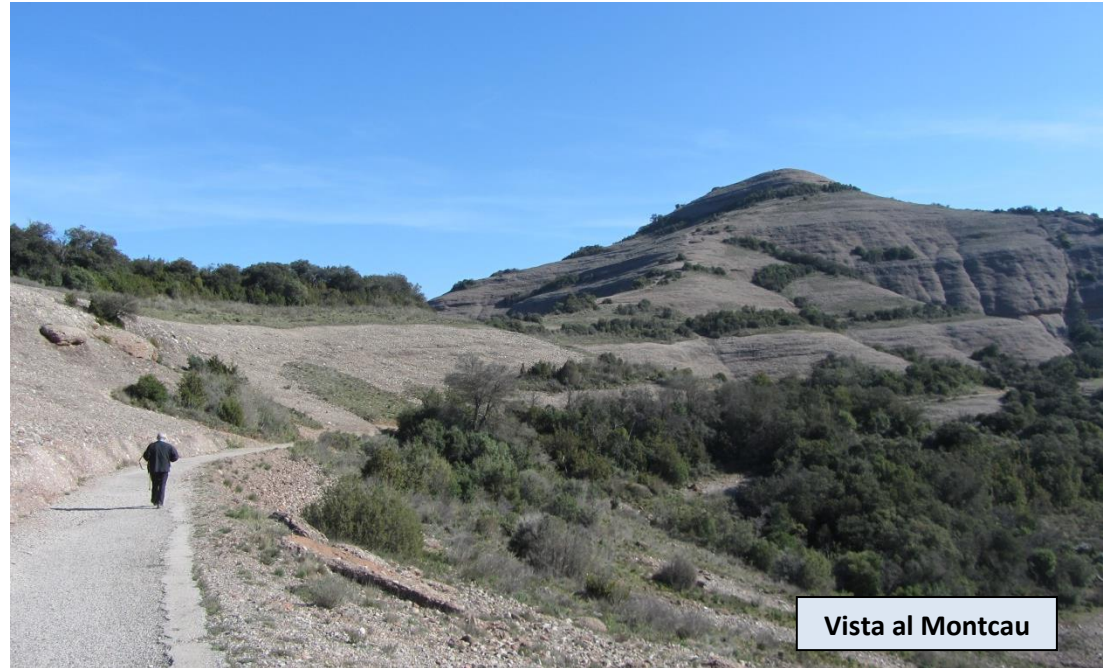
Vista al Montcau

Proseguimos, inicialmente en ascenso hacia el SE, para girar progresivamente hacia el Sur, por terreno cómodo y con buena sombra. Por el camino pasaremos el desvío a Els Òbits, un conjunto de cuevas de interés tan sólo a 200 metros del camino principal. Justo antes de llegar a los pies de La Mola, con vistas hacia el santuario, encontramos el Morral del Drac, un inmenso monolito de piedra con una cruz de hierro en su cima y una grieta en medio de él. Sólo hay que desviarse una decena de metros para visitarlo.