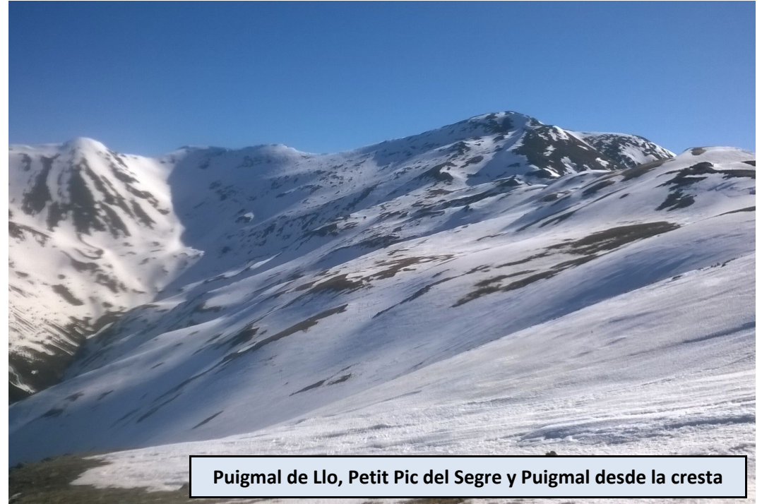
Puigmal de Llo, Petit Pic del Segre y Puigmal desde la cresta

Otra opción desde Aiguaneix es seguir por la pista que asciende recorriendo el fondo del valle, aguas arriba, y se encamina por la Ribera d'Err en dirección al collado entre el Puigmal de Llo y el Petit Pic del Segre. Dejamos esta ruta pronto, en torno a los 2.200 metros de altura, y buscamos ascenso directo a la cima, en dirección E-SE.