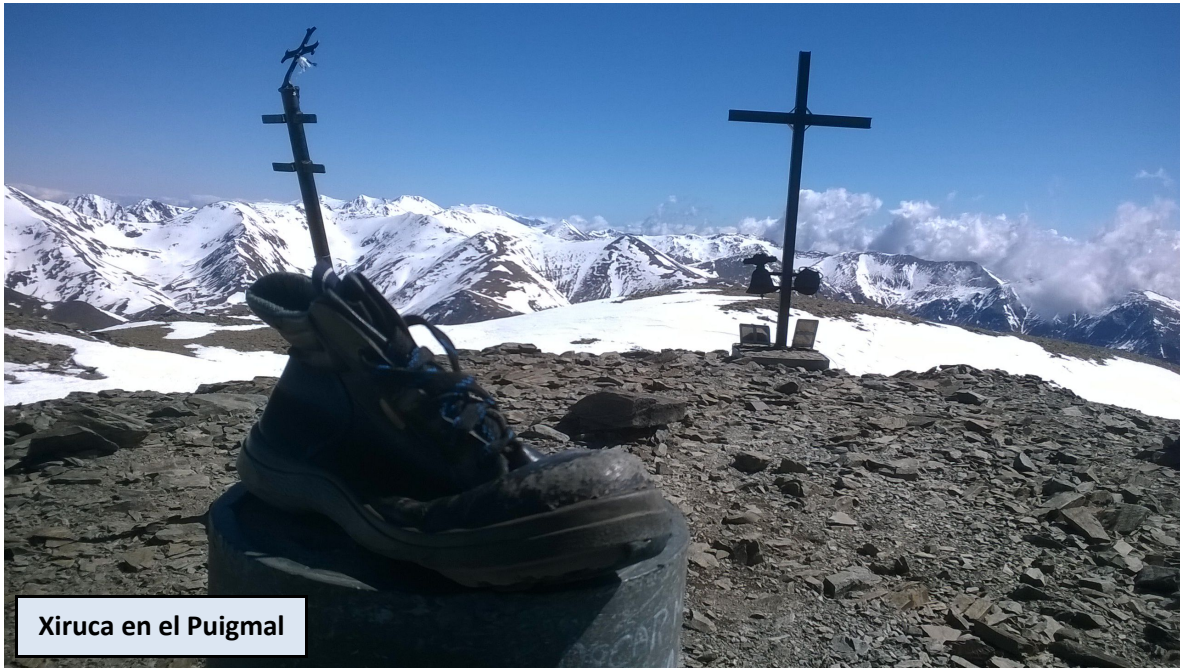
Xiruca en el Puigmal