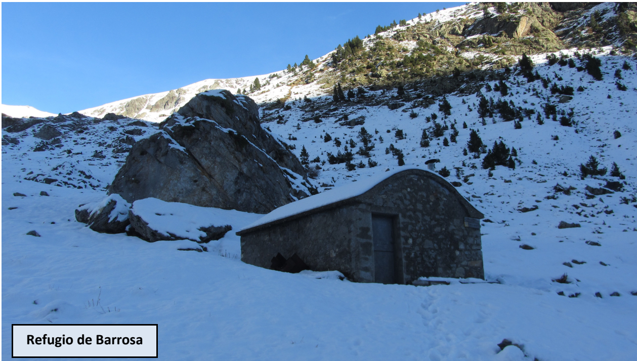
Refugio de Barrosa