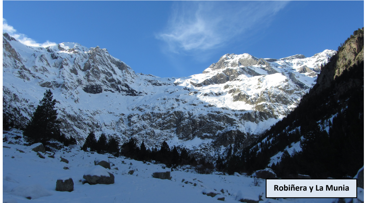
Robiñera y La Munia

Iniciamos la marcha por la pista que asciende hacia las Minas de Liena. En una marcada curva encontraremos unos plafones que nos explican sobre la explotación de dichas minas y del camino de las Pardas. Seguimos ascendiendo por la pista principal, obviando el desvío a las minas. Por el camino hallaremos unos cables al estilo de un telesilla con los que se bajaba el material de las minas. Remontamos el valle por la pista, siempre en la misma dirección (O). Cuando se termina la pista, seguimos ascendiendo por el amplio fondo del valle, con suave inclinación.