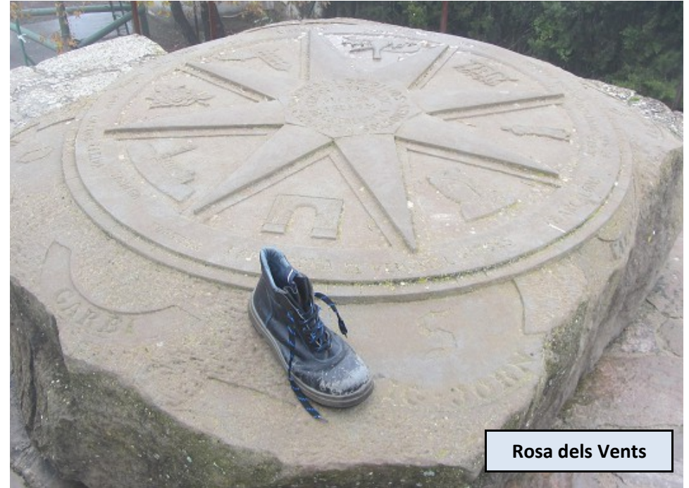
Rosa dels Vents

Cogemos ahora la pista ancha de tierra que avanza un poco por debajo y en paralelo a la pista que da acceso a la Rosa dels Vents, y que coincide con GR, aunque en los primeros metros no haya indicaciones claras. Siguiendo siempre la pista principal, en subida muy leve y sin complicaciones, llegaremos pronto a un vértice geodésico, punto más alto de la Sierra de Pinós.