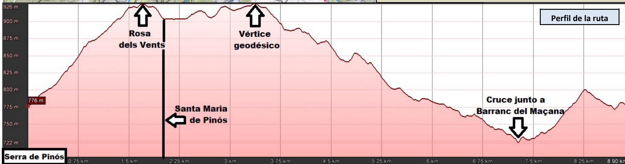
Perfil de la ruta