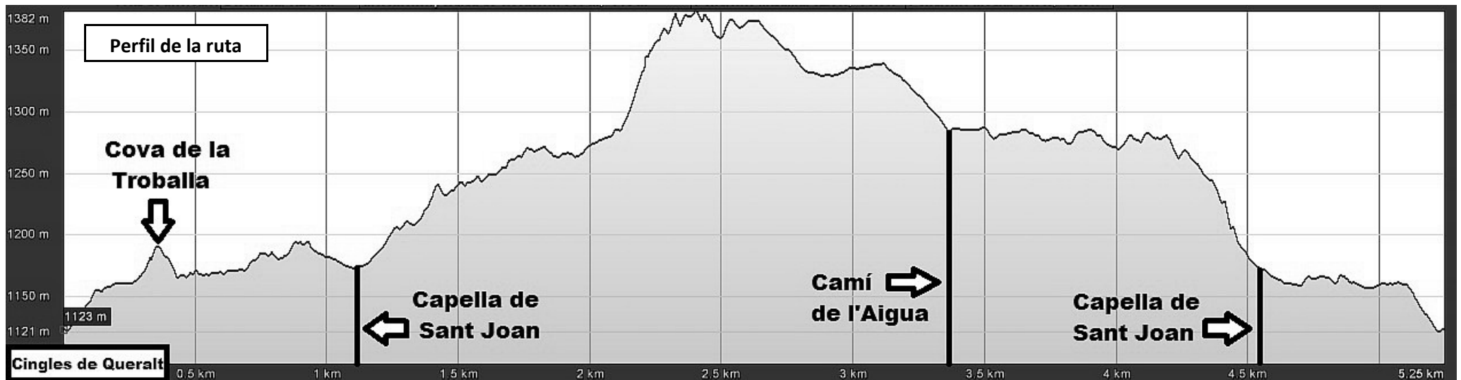
Perfil de la ruta