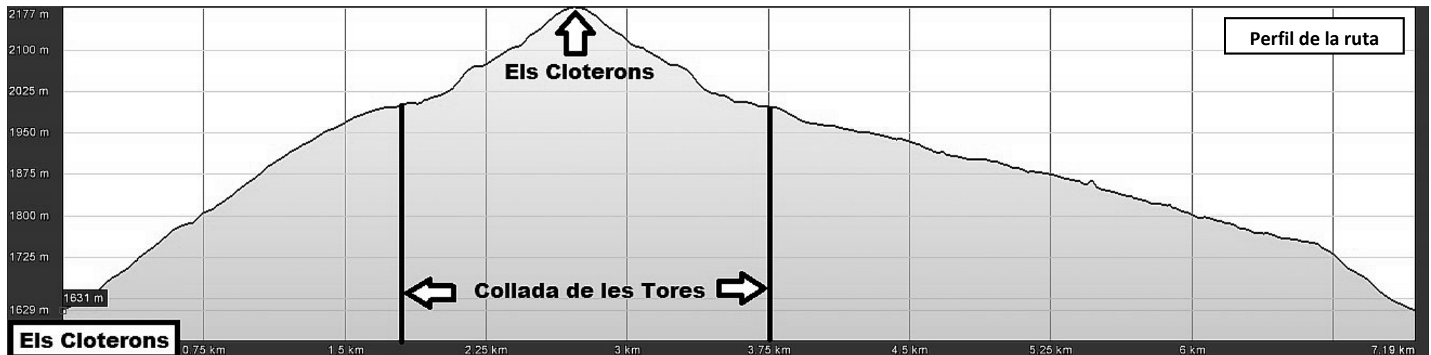
Perfil de la ruta