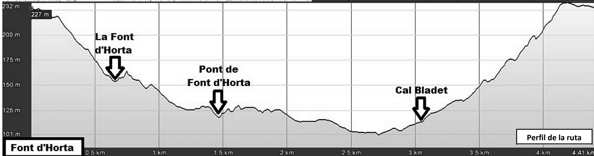
Perfil de la ruta